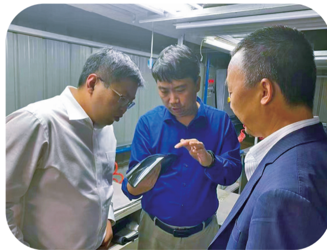
工商银行长春公主岭支行走访农安屯某零部件制造企业,深入车间了解企业发展情况。

工商银行长春分行坚持以习近平新时代中国特色社会主义思想为指导,全面贯彻落实党的二十大精神,深入贯彻总书记关于“三农”工作的重要论述,立足职能定位和主责主业,紧紧围绕守住保障国家粮食安全和不发生规模性返贫两条底线,聚焦农业农村基础设施建设,持续加大“三农”金融支持力度。为更好助力全面推进乡村振兴,加快建设农业强国,长春分行作出如下调整: