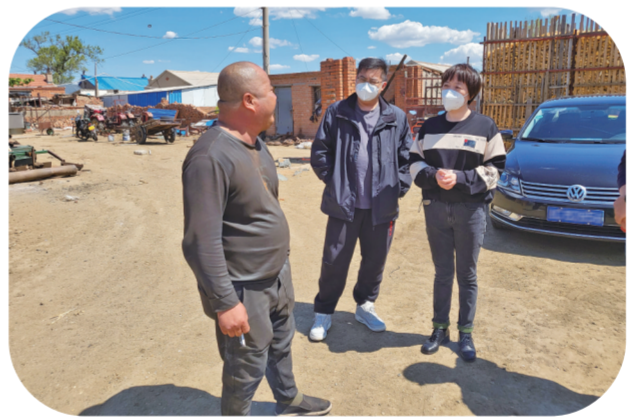
工商银行长春公主岭支行深入了解农户经营情况和资金需求,加快推动普惠产品落地投放。

推动新农主体贷款贡献提升。持续增强新型农业经营主体贷款对全口径涉农贷款的增量贡献度,结合《2023年农业龙头企业清单》逐户做好企业营销服务,深挖客户需求,针对国家级、省级、市级龙头企业制定分层营销策略,实现应贷尽贷;农业合作社、家庭农场方面要继续做好涉农产品的研发和推广,充分利用“信贷直通车”等外部合作平台与机构的渠道资源,实现快速获客。