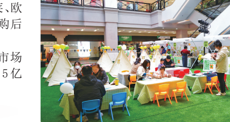
砂之船“春日购物嘉年华·春日好事”市集。

在宽城,每当夜幕降临,华灯初上,很多人便会奔向城北网红新地标——“中东将夜”夜市。