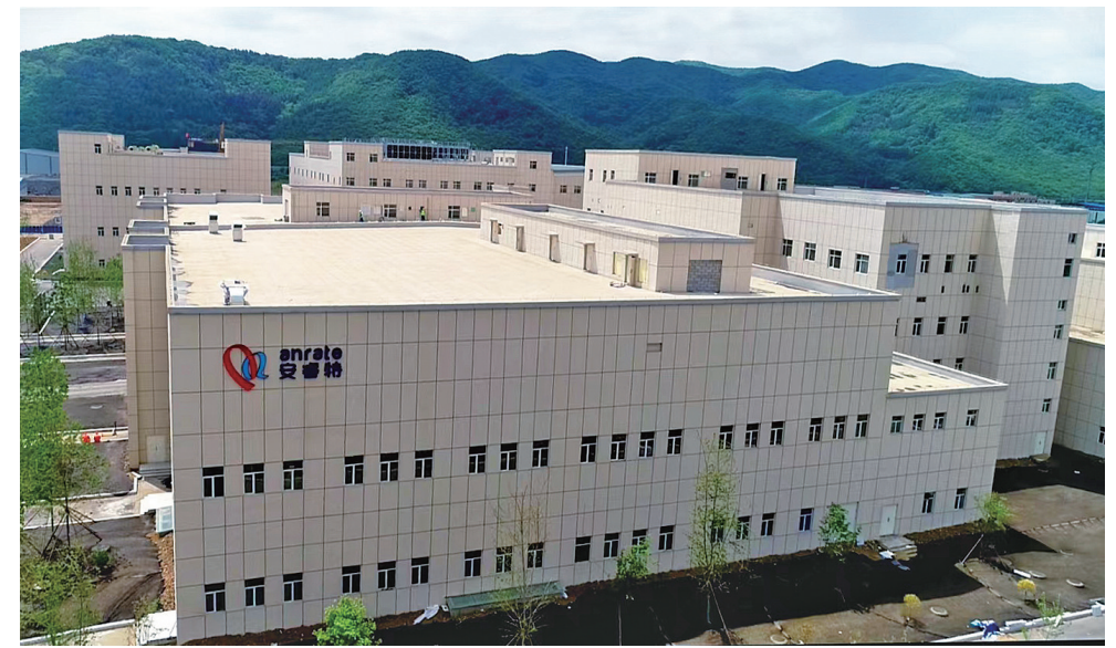
通化安睿特年产100吨重组人白蛋白产业园。

——聚焦加快乡村振兴深化改革。跳出“就农业抓农业、就农村抓农村”的思维,扛稳粮食安