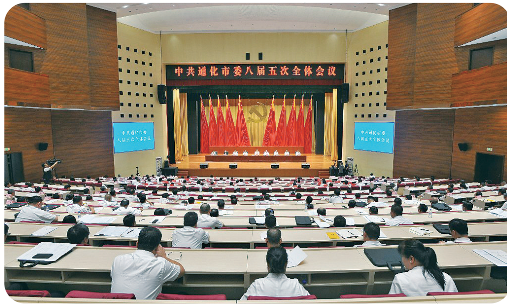
中共通化市委八届五次全会会场。

打响人参产业高质量发展突围战,通化市启动宣地普查、专家委员会筹建、种源数字化管理平台建设、区域品牌创建等工作。在吉林省长白山人参推介会上签约澳洲人参深加工等15个重点项目。百泉西洋参种植基地等8户企业获评省级道地药材科技示范基地,数量位居全省首位。围绕“一城十线百景千亿级”格局,通化市全