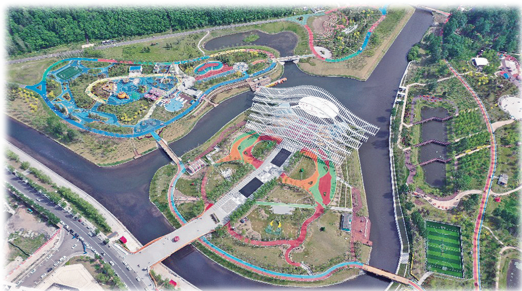
彰显生态人文的佟佳江旅游度假区已成为国内外游客的“打卡地”。