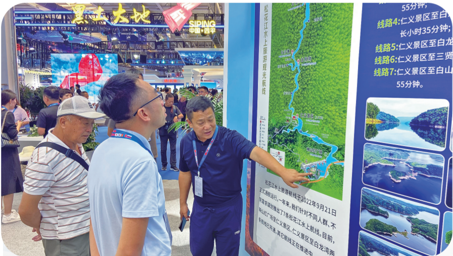
集山水观光、休闲娱乐、民俗体验、景观地产于一体的松花江旅游经济带,吸引众多市民参观。