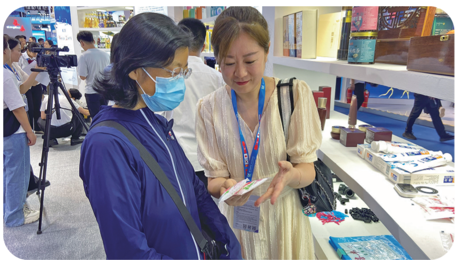
琳琅满目的特色产品受到市民青睐。