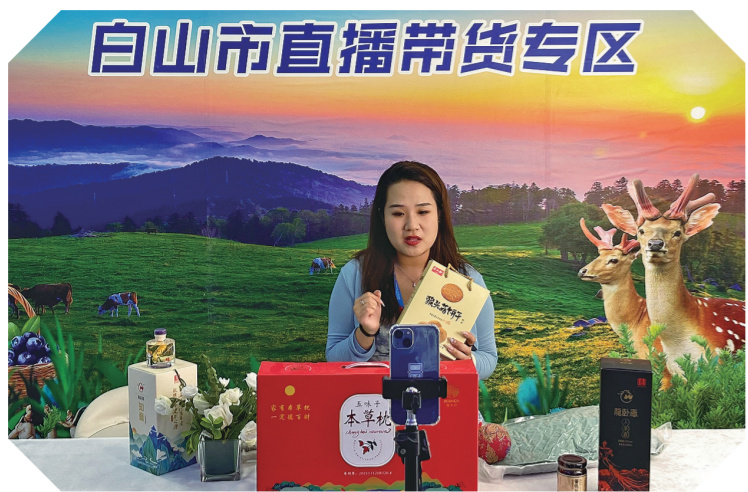
线上线下相结合,直播间内不间断推介白山特色产品,订单不断,捷报频传。