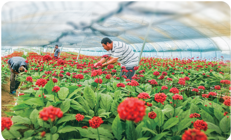
利用得天独厚的区位优势高质量发展人参产业。