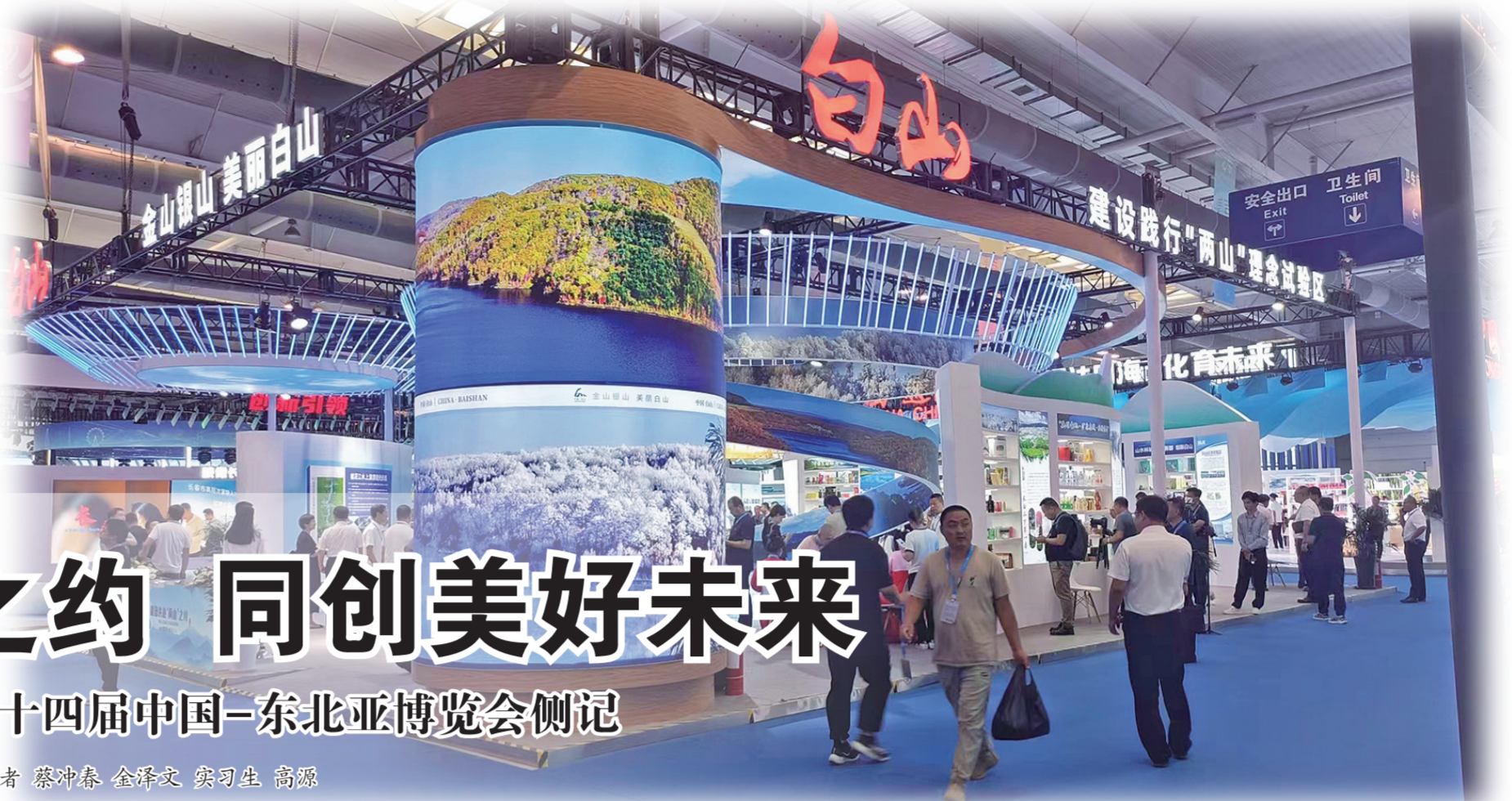
白山市投资形象展馆让观众将白山的优美秀丽尽收眼底。