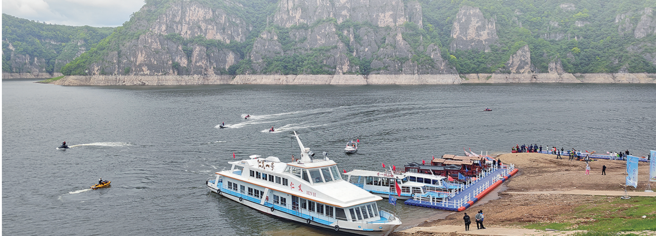
松花江靖宇段水面宽阔,水流平稳,特别适合开发水上旅游观光,针对不同人群不同需求,谋划推出了7条水上观光航线。

十四次相约,十四次拥抱。8月23日,随着第十四届中国—东北亚博览会的大幕开启,白山市与八方来客共叙友情,携手谋划合作大计,共话商机,描绘发展美好蓝图。