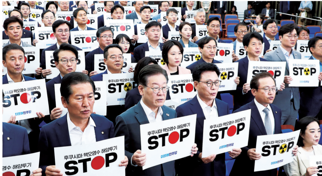
8月24日,韩国最大在野党共同民主党党首李在明(前排左二)与议员在首尔国会举行的紧急会议上举手举标语,抗议日本核污染水排海。