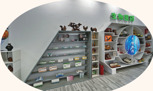
生物医药展区的最新药品数目繁多。