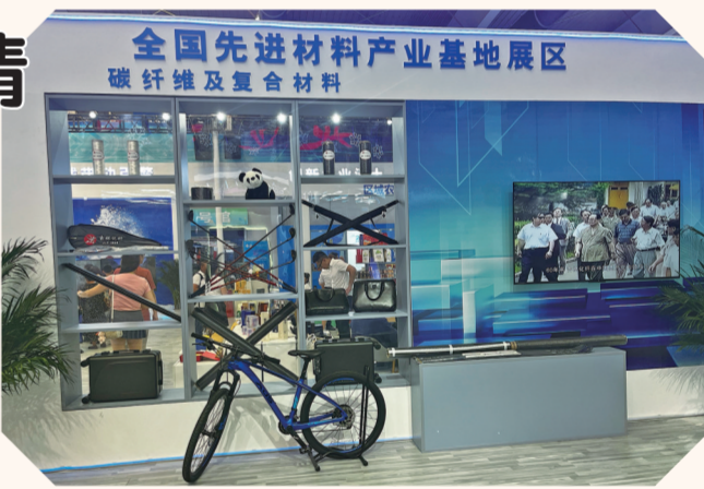
吉林市城市展区内先进材料区域展示满满的科技含量。

此次展会,吉林化纤还展示了纺织用新型纤维原料,包括全球首创的天竹纤维及差别化产品、再生腈纶纤维,以及循环再生系列的人造丝。这些新产品、