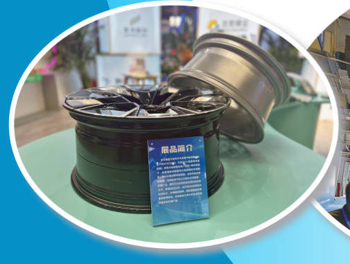
吉林市城市展区内展示的汽车轮毂最新产品。