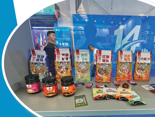
农副产品及深加工制品展区产品种类繁多。