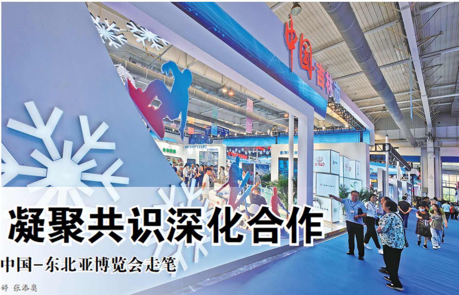
吉林市城市展区整体形象。

吉林市委、市政府高度重视,高位推动本届中国-东北亚博览会参会工作,成立由党政主要领导亲自挂帅,各县(市)区、开发区和市直有关部门32个成员单位组成的组委会,制发参会组织工作方案,高质量完成展区设计搭建、组展、客商邀请、参加会议活动、客商团组陪同接待等各项参会工作任务,全市上下齐心协力确保吉林市参会工作圆满成功,收获丰硕成果。