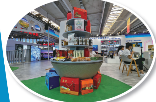
农产品区域内各类产品品种齐全。