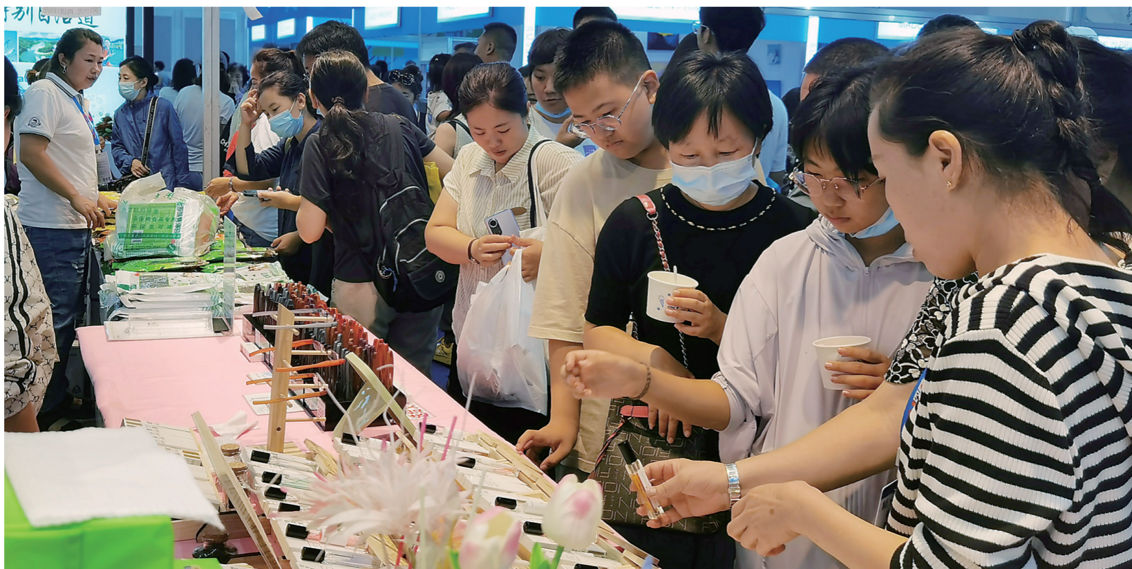
8月26日，东北亚博览会各展馆里人头攒动，各展区展位的精美商品吸引众多客商体验、购买。