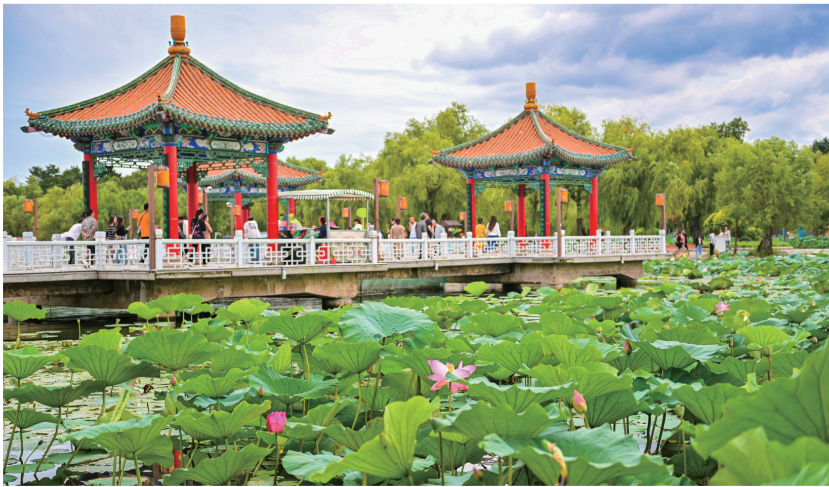
时下,长春市南湖公园的荷花正是观赏期,放眼望去,“惟有绿荷红菡萏,卷舒开合任天真”的景色尽收眼底,吸引市民驻足观赏。