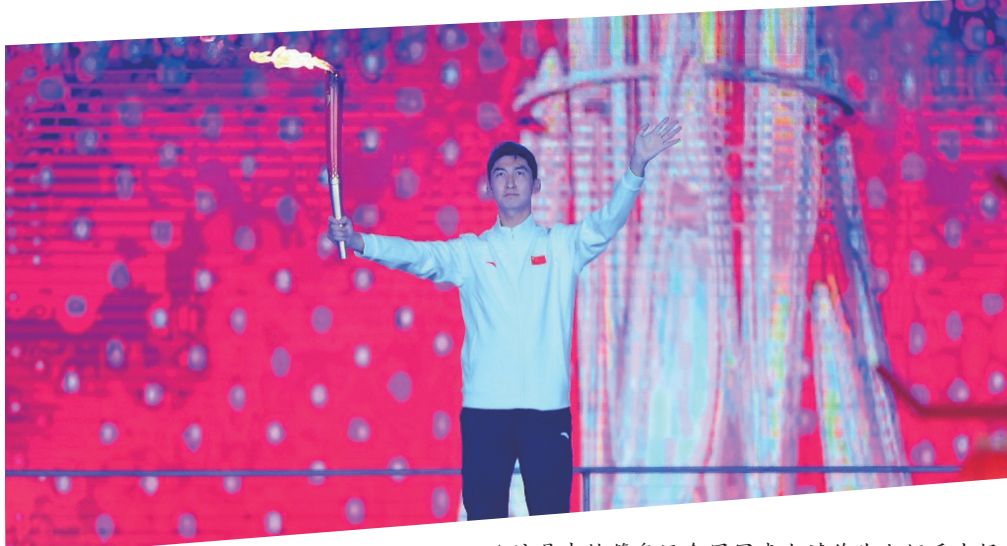
▲这是吉林籍奥运会冠军武大靖作为火炬手出场。