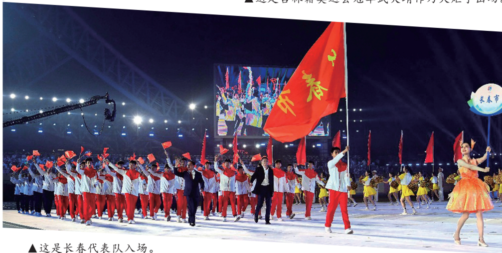
▲这是长春代表队入场。