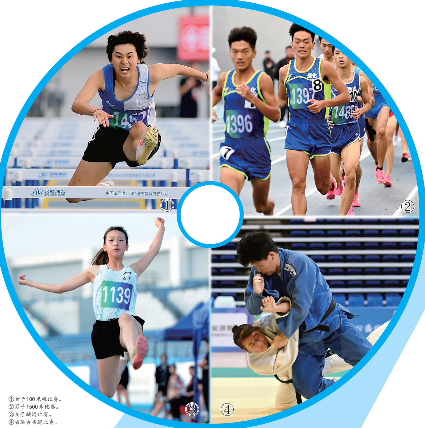
①女子100米栏比赛。 ②男子1500米比赛。 ③女子跳远比赛。 ④省运会柔道比赛。