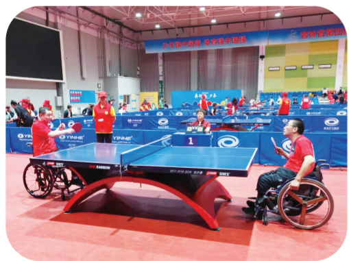
省残运会乒乓球比赛。

金秋时节硕果飘香,温暖残梦绽放。9月13日,吉林省第四届残疾人运动会圆满完成各项赛事,在梅河口市落下帷幕。按照全国运动会与残运会同城同期举办的做法,本着“精简办赛”和“两个运动会一样精彩”的原则,经省政府批准,本届省残疾人运动会与省第十九届运动会一并举办开幕式,分项目进行比赛。