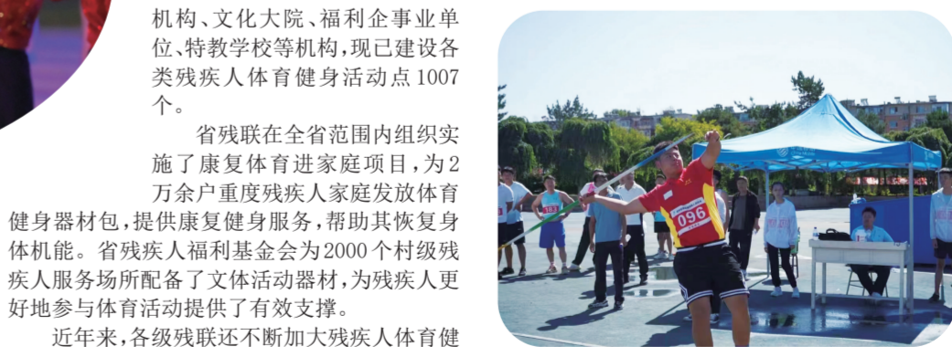
省残运会标枪比赛。

及学校、公园等资源,积极开展越野滑雪、雪地拔河、雪地足球、迷你滑雪、冰雪那达慕、拉雪橇、雪地推轮椅、旱地陀螺、旱地冰壶等丰富多彩的冰上、雪上系列体验活动,带动和鼓励更多的残疾人朋友走出家门,融入“三亿人参与冰雪运动”。目前,冰雪季活动已实现了吉林省全覆盖。