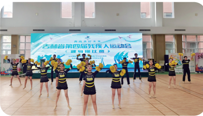
省残运会健身操比赛。

我省的残疾人群众体育工作硕果累累。各地残联通过线上线下相结合的方式,持续开展残疾人健身周、特奥日、冰雪运动季等群众体育活动,康复健身体育活动“一地一品牌”扎实推进,全省各地依托乡镇(街)、村(社区)、康复站、托养