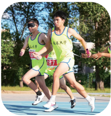
省残运会田径比赛。

2021年,在全国第十一届残疾人运动会暨第八届特奥会上,我省参赛运动员不负重托、奋力拼搏,获得残运会项目22枚金牌、9枚银牌、17枚铜牌;获得特奥会项目22枚金牌、24枚银牌、18枚铜牌,奖牌总数112枚,打破4项全国残运