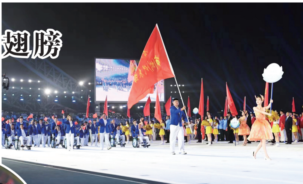
↑吉林省第十九届运动会暨省残运会开幕式省残运会运动员方队入场。