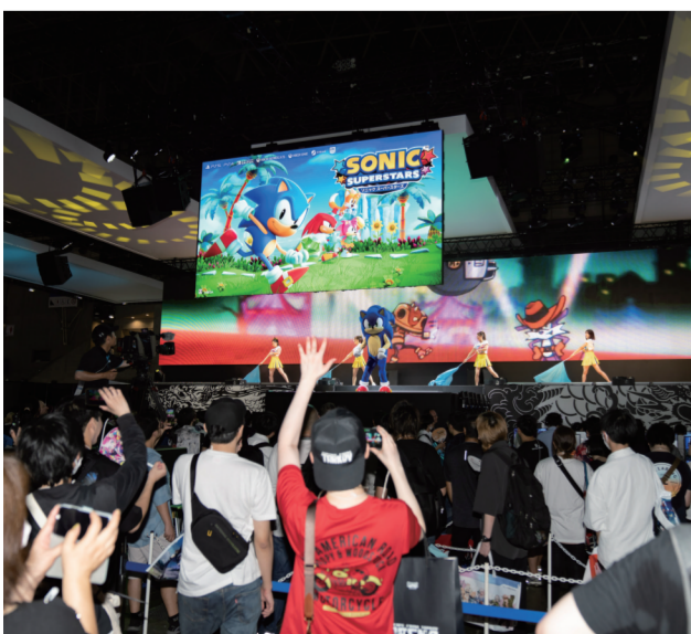
9月21日,在日本千叶县幕张展览馆的东京电玩展上,人们观看世嘉展台的索尼克表演。当日,为期四天的2023年东京电玩展在日本千叶县幕张展览馆开幕,共有来自44个国家和地区的787家公司参展。

2022年客观题考试保留有效成绩人员,2023年客观题考试合格人员,应于规定期限内登录司法部官网确认参加主观题考试并交纳考试费。参加主观题考试人员,可于2023年10月10日至14日登录司法部官网自行打印准考证。主观题考试时间为2023年10月15日,考试时间240分钟。