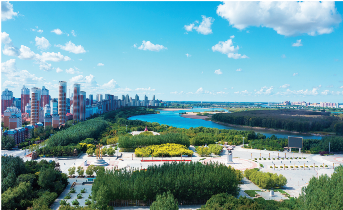
不断加大“生态强市”建设，松原市生态环境越来越好。

强劲措施，有效落实，让松原的生态环境质量明显提升。2022年，松原全市环境空气质量达到二级标准以上天数337天，优良天数比例92.8%，优于考核指标1个百分点，PM2.5平均浓度25微克每立方米，优于考核指标2微克每立方米。7个国考断面中，查干湖入湖口、湖心水质稳定在IV类，其余5个均达国家考核要求。土壤环境质量保持稳定，受污染耕地安全利用率和污染地块安全利用率达到90%以上。前郭尔罗斯蒙古族自治县被命名为全国第二批“两山”