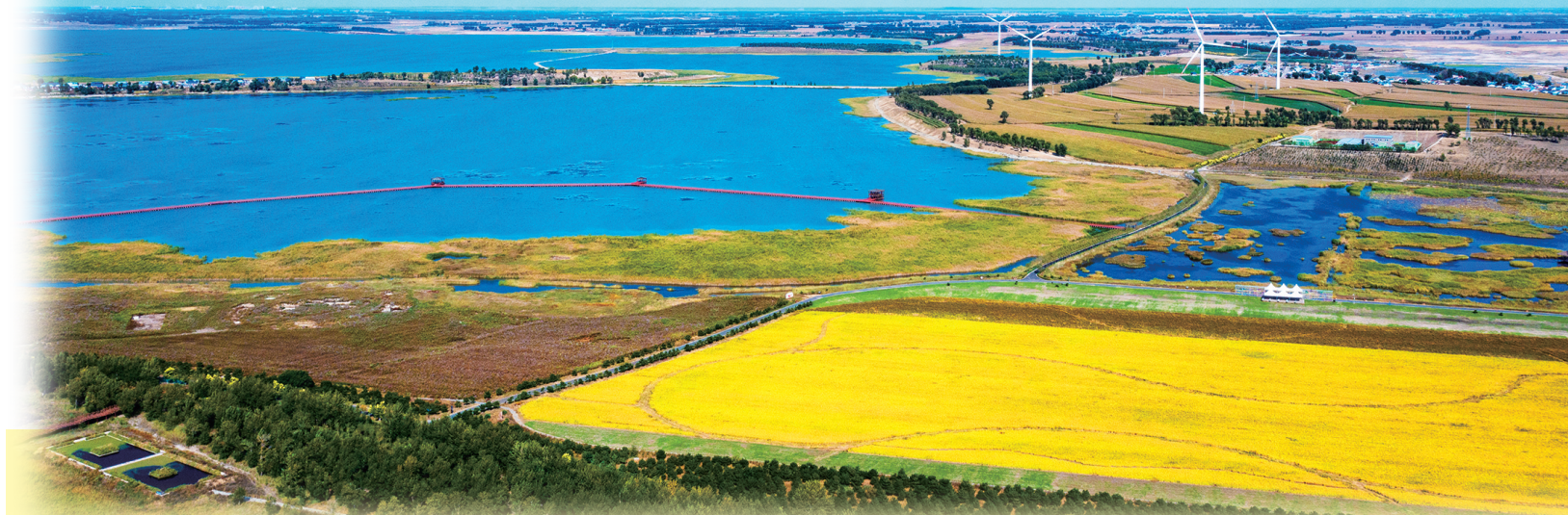
秋日的查干湖湿地风光。