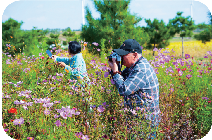
游客在契丹岛百花园内拍照留念。