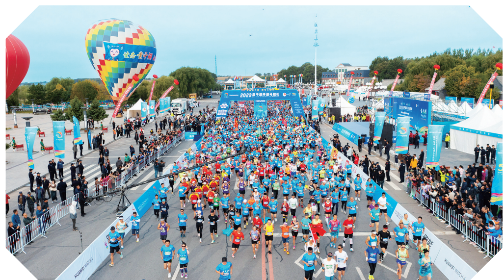
查干湖环湖马拉松。