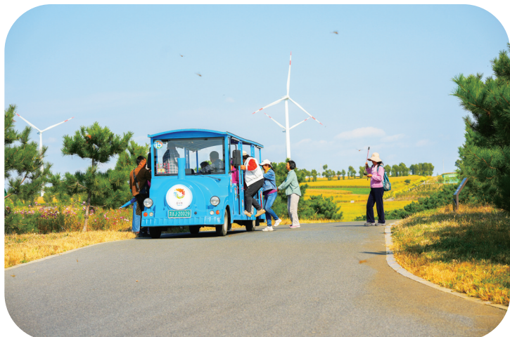
游客乘坐电动观光车在查干湖景区游览。