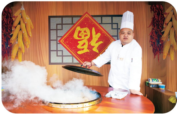
查干湖特色美食铁锅炖鱼。