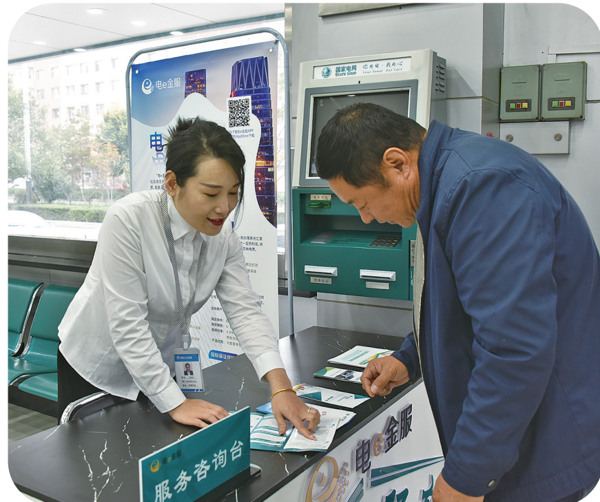
在刚刚过去的中秋、国庆“双节”期间,国网农安县供电公司城南、城北供电分中心营业窗口的员工主动放弃假日休息,坚守工作岗位,热情接待节日期间前来办理业务的客户,确保营业运转正常。

该公司将保障留守老人安全用电作为一项重点工作,把党建与供电服务深度融合,建立关心关爱留守老人等群体的常态机制,构建“亲情式”服务体系。下一步,该公司将持续积极履行社会责任,定期开展电力暖心上门服务,将关爱和帮助留守老人作为提升优质服务工作的出发点和落脚点,积极为留守老人排忧解难。