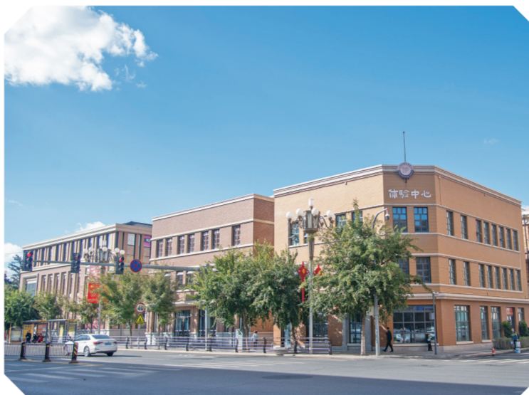
北京大街西历史文化街区。

走进长春国际汽车城创意汽车研发产业园项目现场，一座座现代化厂房拔地而起。“长发速度”在该项目建设上再创新纪录：1个月内即完成场地平整工作，节约工期30余天；5天内取得绿证、环评批复、水土保持批复等，节省工期达60余天；克服冬季施工困难，仅用时3个月即完成厂房暖封闭……据项目现场工作人员介绍，该项目建成后达产，可实现年产值260亿元，解决1000余个就业岗位，将进一步提升中国一汽新能