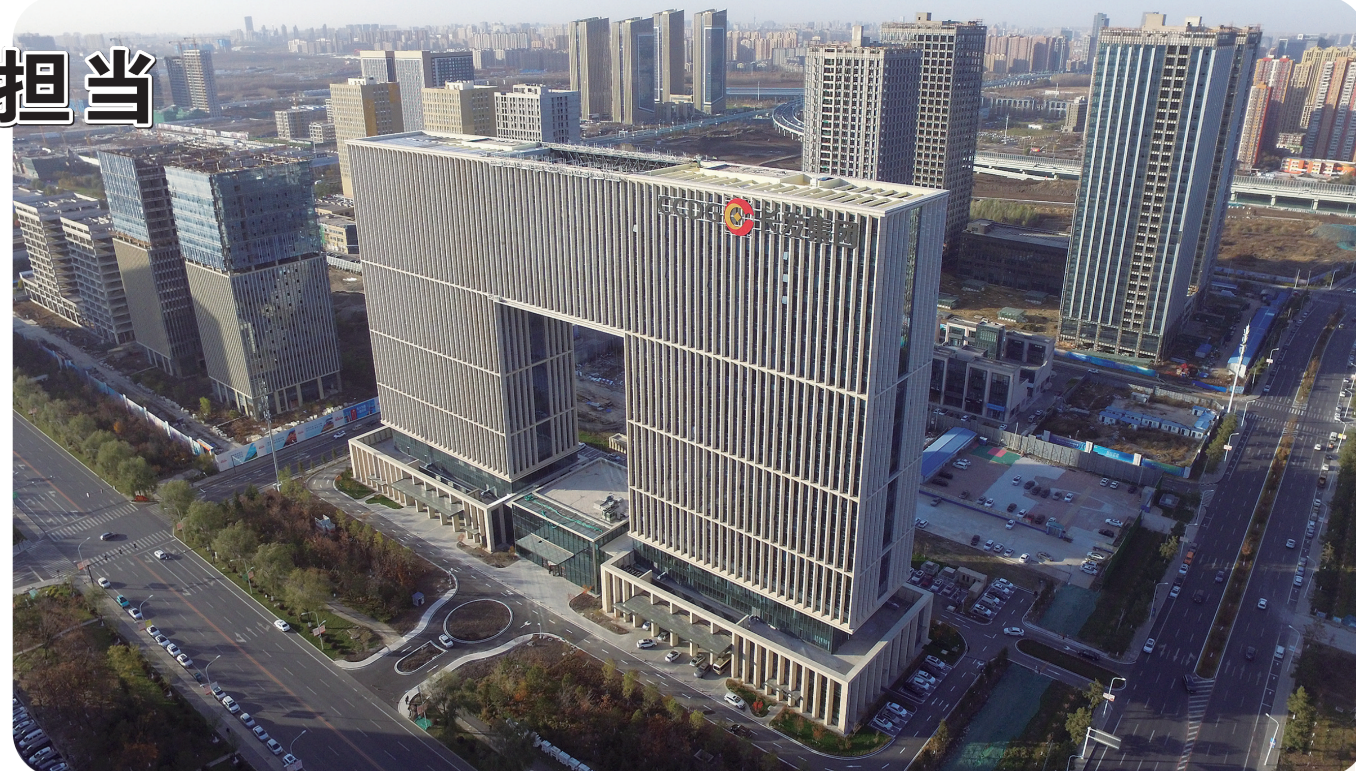
长春市城市发展投资控股(集团)有限公司。

近年来，长发集团旗下所属的金融公司及子公司秉承“依托供应链，建立信用链，打通融资链，提升价值链”的发展理念，深耕内建行业，为某建设公司设计以应收账款受让、应收账款质押、融资服务、应收账款管理为主的综合金融服务产品，快速缓解了该企业资金压力。三年来，已累计为该建设公司提供综合金融服务几十笔，累计金额近20亿元，为企业在提升总产值、扩大市场份额方面增添动能。