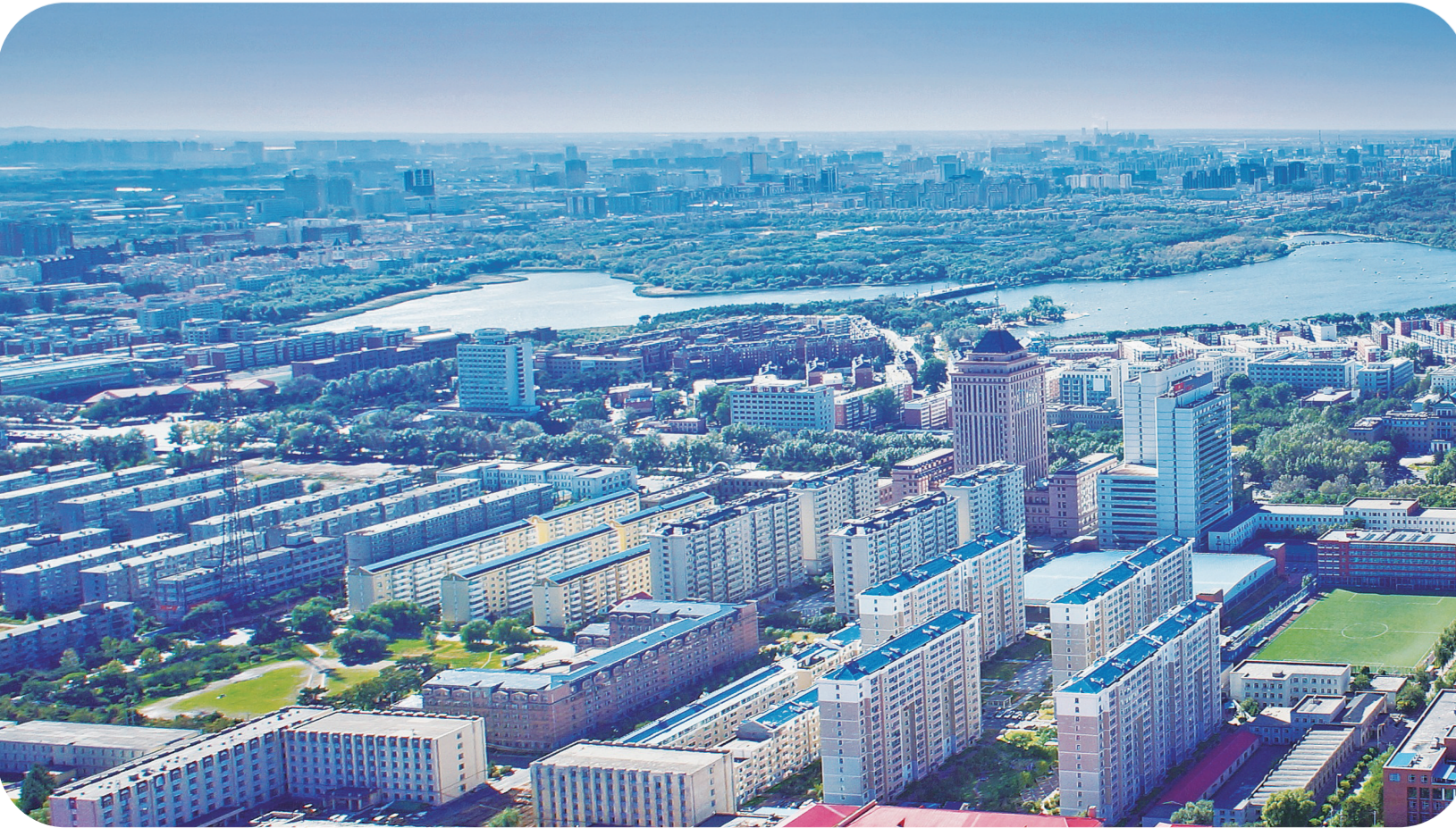
旧城改造提升项目让城市展新颜。

奋斗与发展接力，挑战与前行相随。站在新的起点，长发人斗志昂扬：长发集团积极落实省委“一主六双”高质量