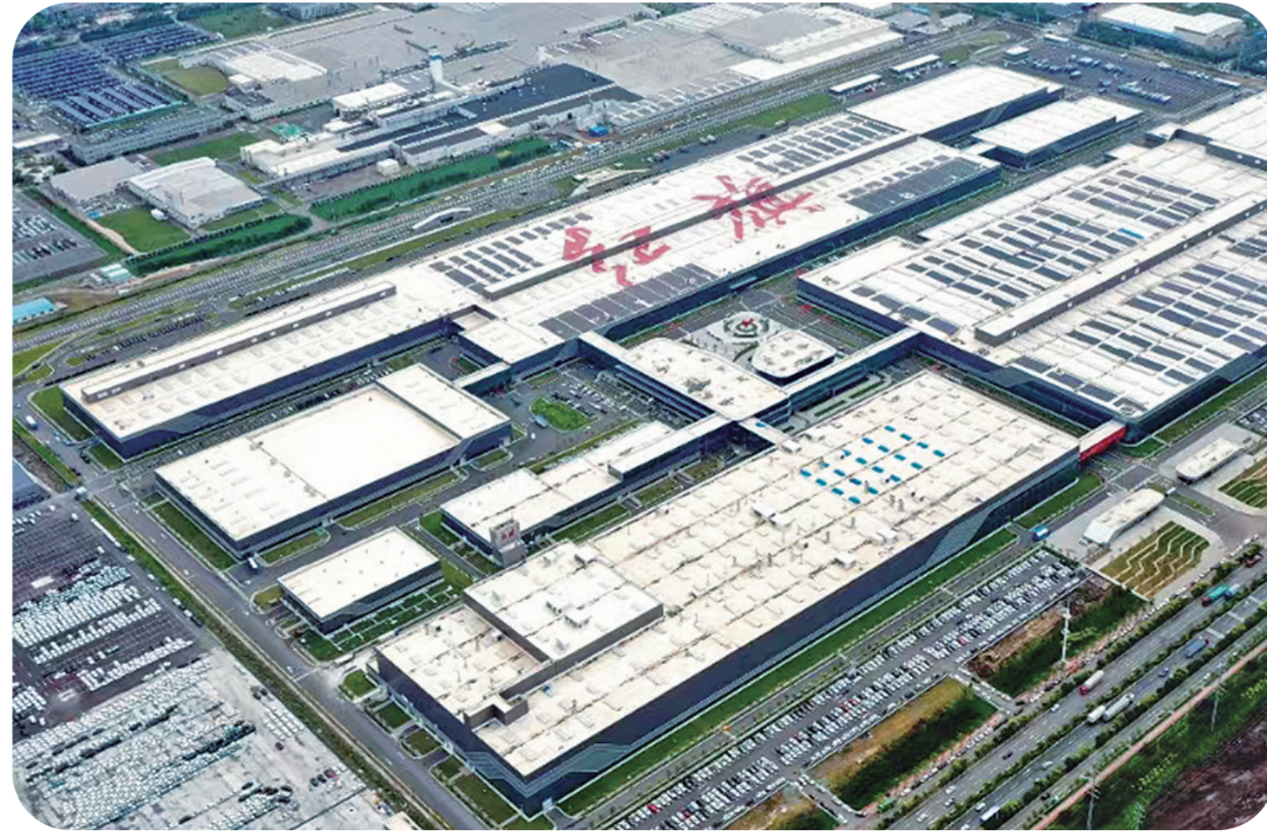
长春经开区繁荣智能制造产业园项目。