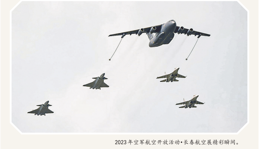
2023年空军航空开放活动·长春航空展精彩瞬间。