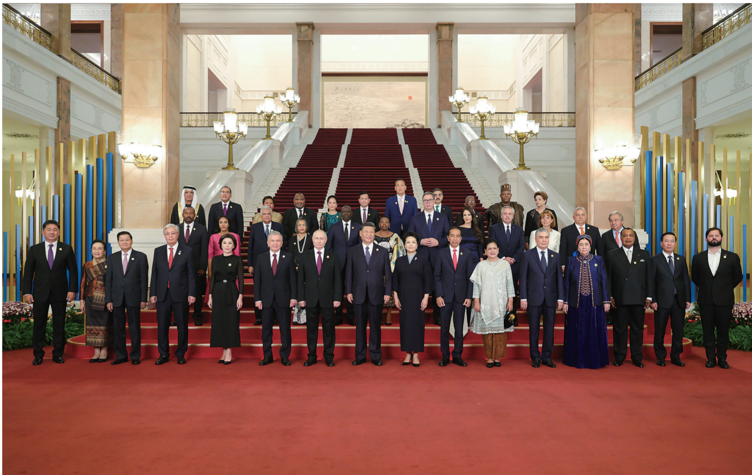
10月17日晚,国家主席习近平和夫人彭丽媛在北京人民大会堂举行宴会,欢迎来华出席第三届“一带一路”国际合作高峰论坛的国际贵宾。这是习近平和彭丽媛同国际贵宾合影留念。