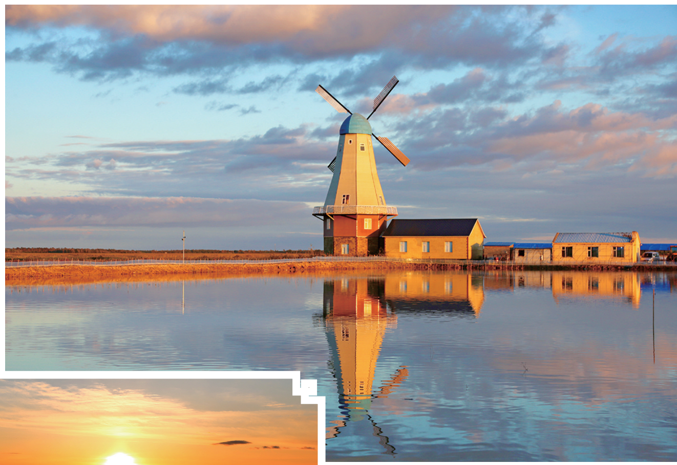
夕阳下牛心套保,使人仿佛置身于昏黄暖意的调色盘之中。王晓雨 摄