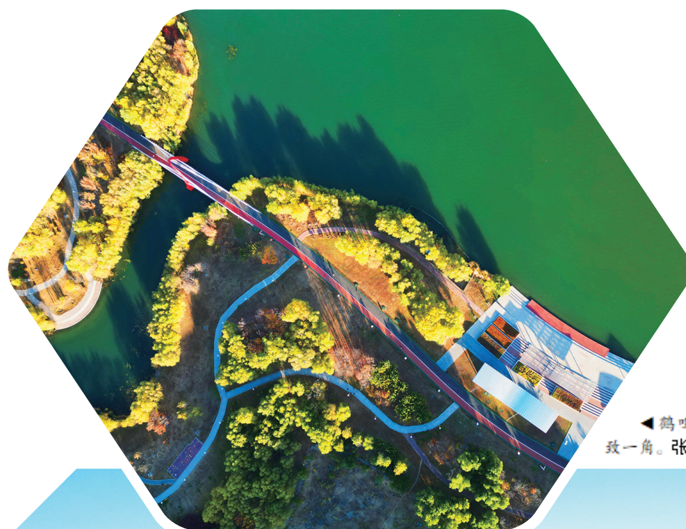
鹤鸣湖景致一角。