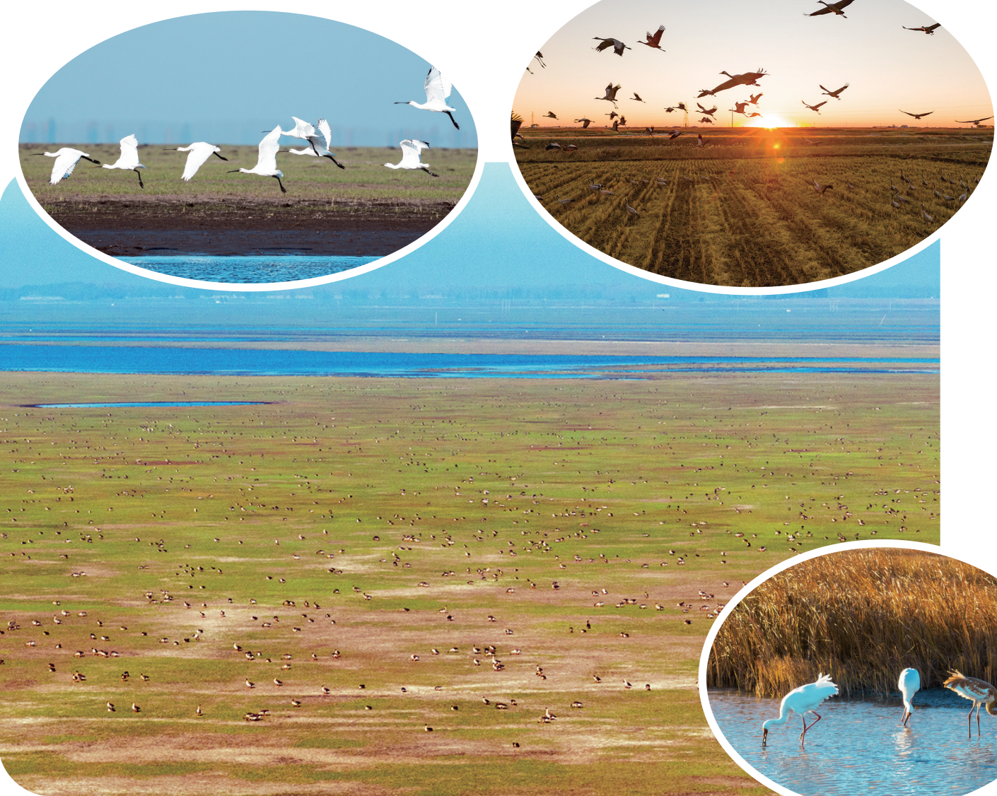
镇赉县嫩江湿地,数万只大雁“刷存在感”。