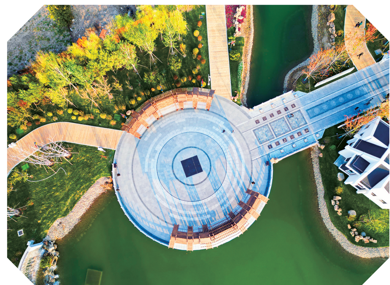
通过打通春华湖、秋实湖两处滨水空间,加快形成“五湖相拥、碧水绕城”的生态水系,让城区的日常空气更湿润、市民的生活环境更宜居。图为秋实园。