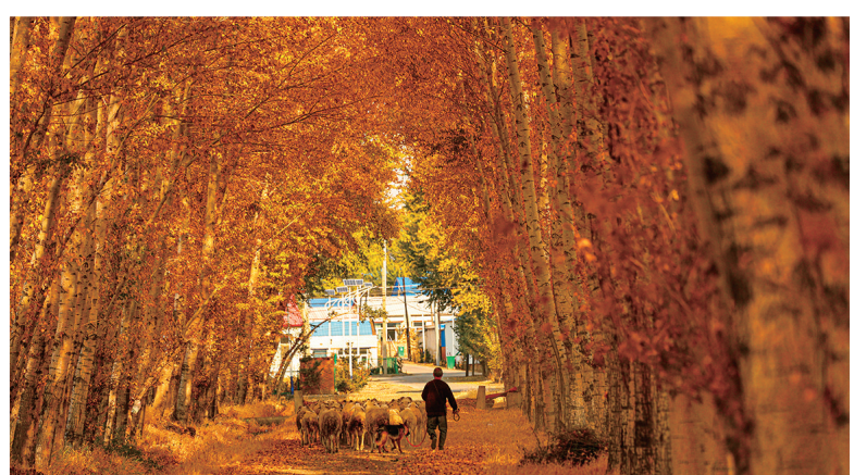
洮南市福顺乡幸福村黄金路。