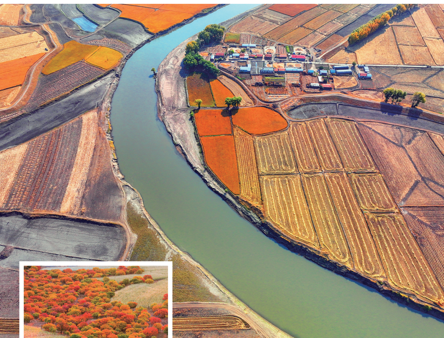
洮儿河福顺湾。