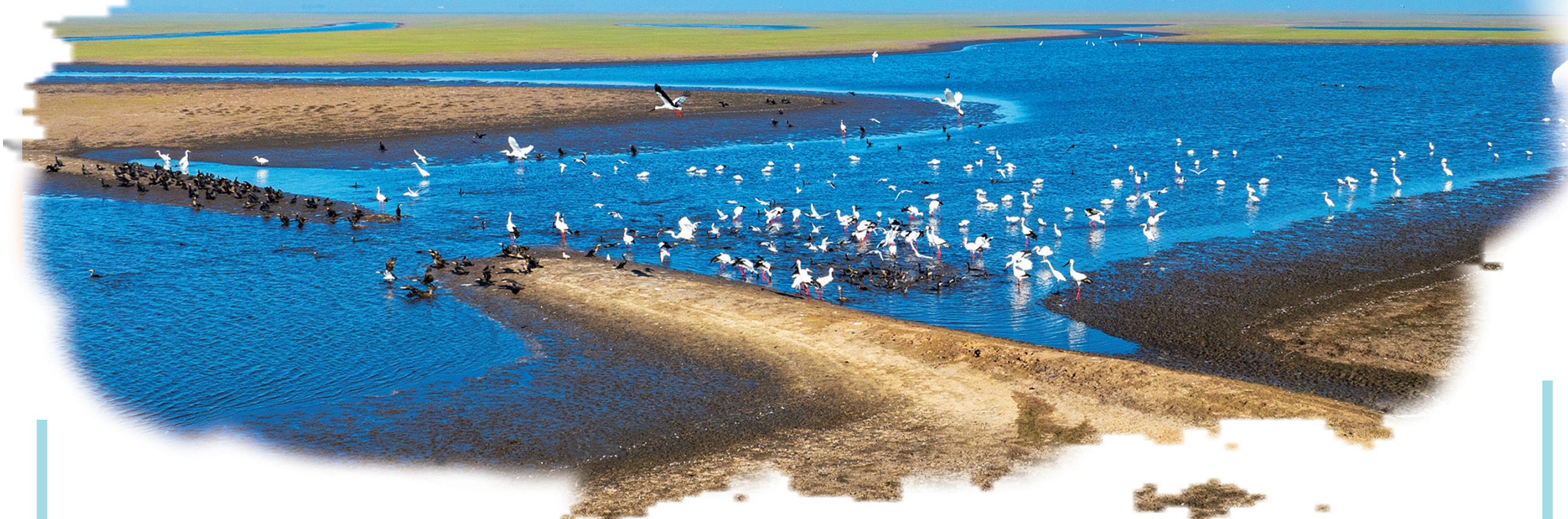
莫莫格湿地,东方白鹤、白琵鹭、大白鹭、鸥、红嘴鸥等珍稀水鸟在集体觅食。