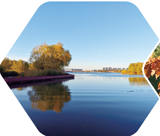
静谧湖水,倒影成诗。