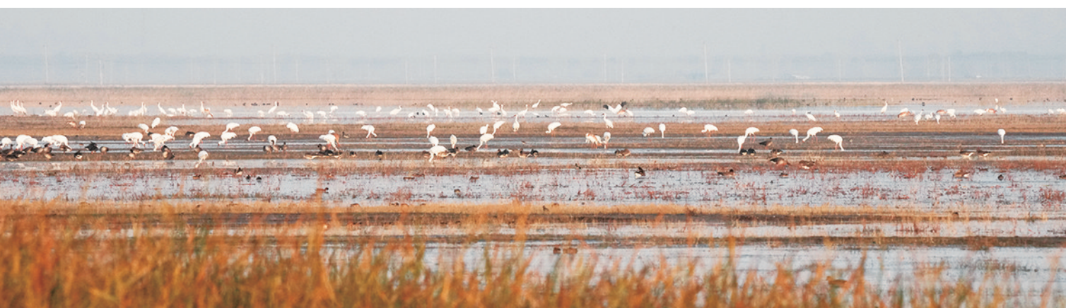
白鹤在湿地觅食。