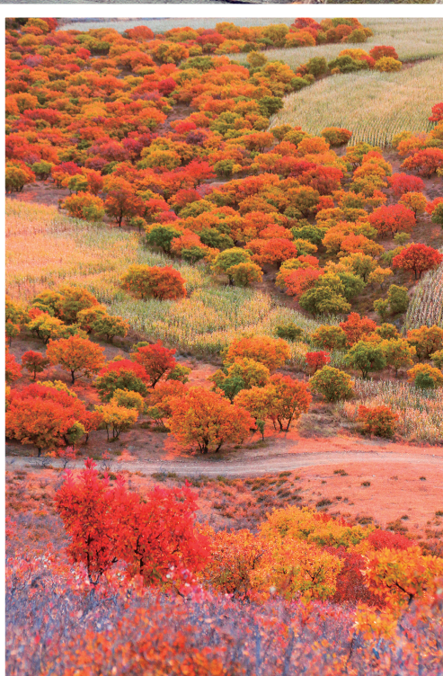
洮南市闹牛山秋色。