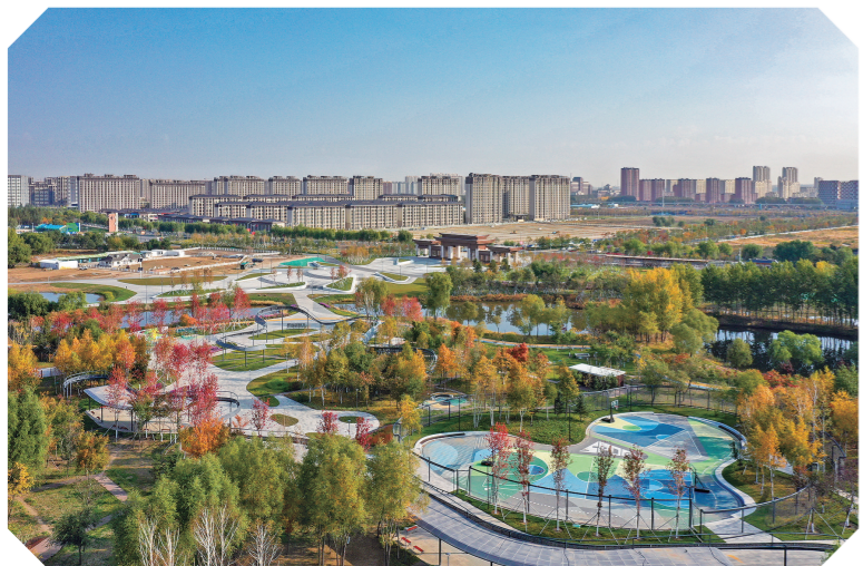
长春北湖国家湿地公园。