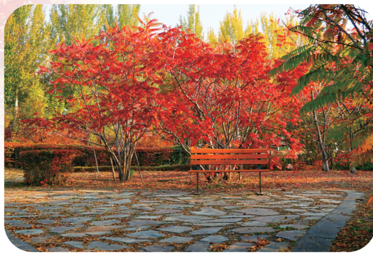
长春国际汽车公园。