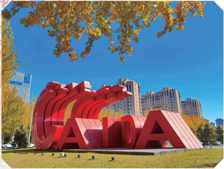
城市雕塑与秋色完美融合。