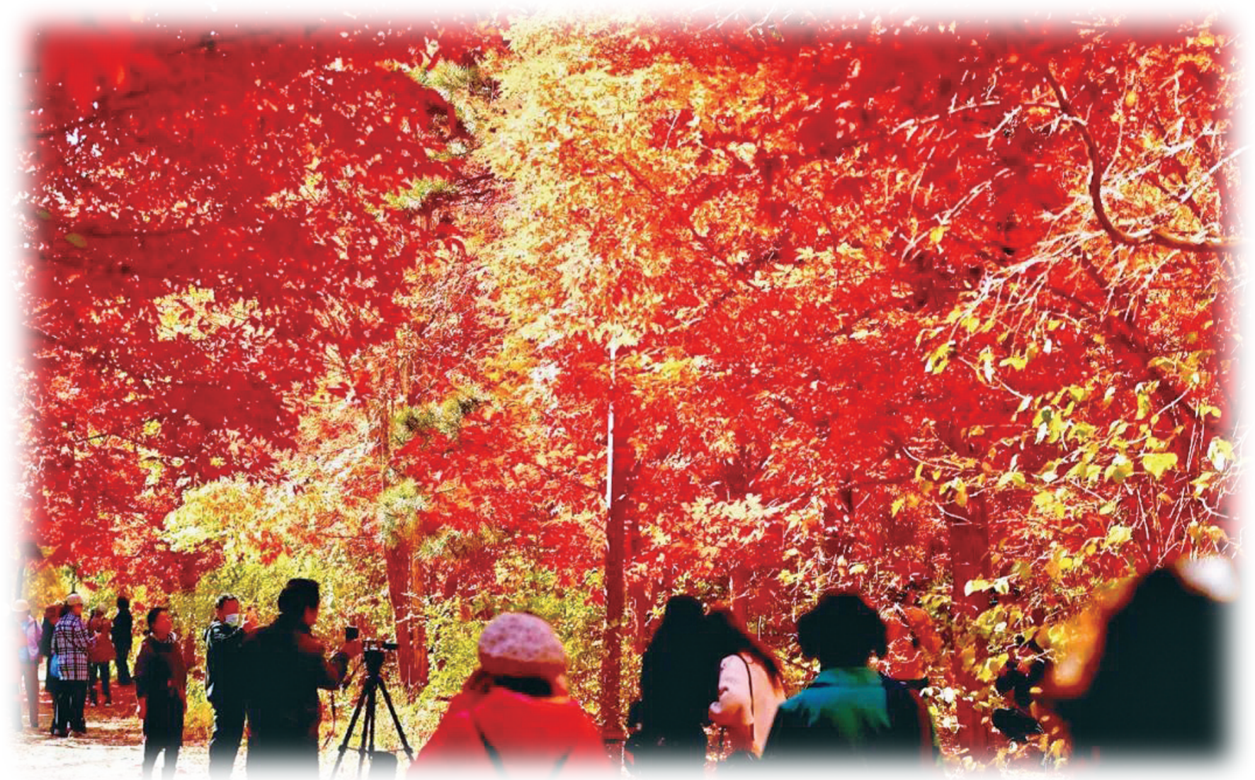
南湖公园的枫叶红了，引来众多游人观赏。