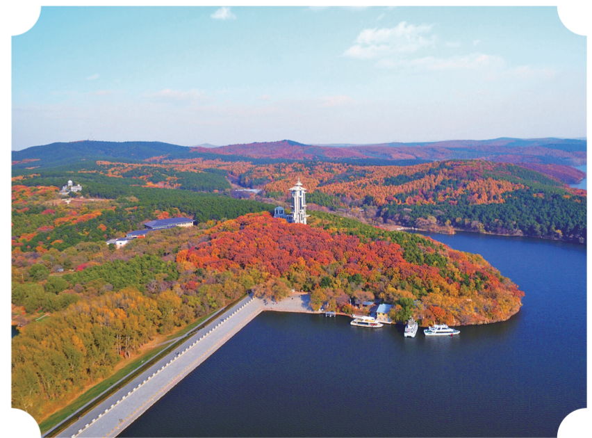
净月潭国家森林公园。