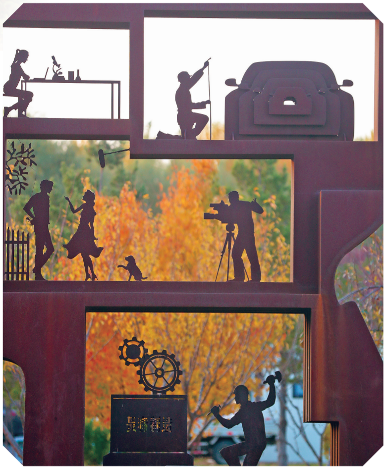
伊通河工业轨迹公园。