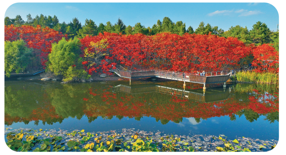
长春水文化生态园。