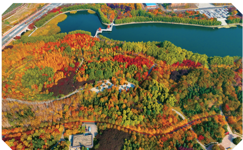
长春友谊公园。