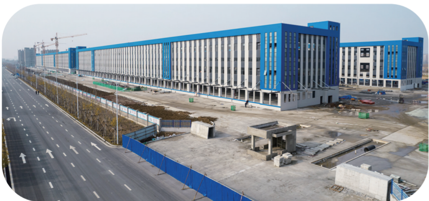
范家屯东北智慧物流园区内,中通物流项目建设现场。

在这个收获的季节里,在距离长春市城区中心直线距离21公里处,范家屯东北智慧物流园区项目也在收获着属于自己的“成熟果实”。