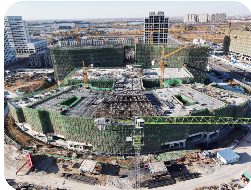
浙大妇院吉林医院、长春市妇产医院、长春市妇幼保健院西部院区项目建设现场。

据悉,该项目位居全国妇产科第一方阵的浙江大学医学院附属妇产科医院(简称“浙大妇院”)为输出医院,以拥有百年历史的长春市妇产医院为依托医院,通过全面合作、整体托管的形式,合作共建国家区域医疗