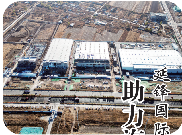
延锋国际(长春)智能座舱项目建设现场。

之变革振兴之基,一汽弗迪将积极助力我省和老东北基地汽车产业振兴,做优、做强产业链供应链,加快促进产业集群集聚,持续完善产业生态体系,推动民族汽车品牌在新能源赛道上实现超越领先。