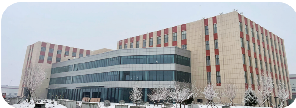
一汽弗迪动力电池一期项目建设现场。

在一汽弗迪动力电池一期项目建设场地,各项施工作业有序开展。目前pack厂房工艺设备已调试完成,并于7月21日完成首件下线;电芯1线工艺设备已全部入场就位,其中制片车间设备已完成安装,已试制电芯