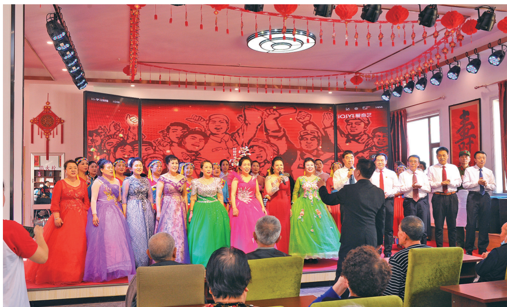
本版图片为资料图片

立足新起点,启航新征程。全市文联文艺工作者肩负繁荣创作、服务人民的使命任务,把心、情、思沉到人民之中,紧扣时代脉搏,以文弘业、以文培元,以文立心、以文铸魂,在为人民抒写、抒情、抒怀中再铸四平文艺新辉煌。