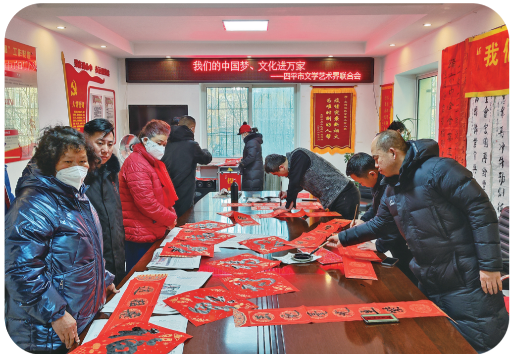
四平市书法家协会走进社区开展“我们的中国梦”文化进万家活动。

7月27日,由四平市委、市政府主办,市委宣传部、市文联承办的“嗨动英雄城 悦享生活”第十八届四平市“九月鲜花”文艺展演周活动开幕。精选出来的26家优秀单位(团体),共举行了8场演出,包括音乐家协会专场、舞蹈家协会专场、九月鲜花艺术团企业文联专场、第五届古筝文化艺术节专场等。共演出文艺节目105个,涵盖歌曲、舞蹈、器乐、戏曲、二人转、诗朗诵等多种艺术形式,参演水平高、社会影响好,成为四平文艺的亮丽品牌。