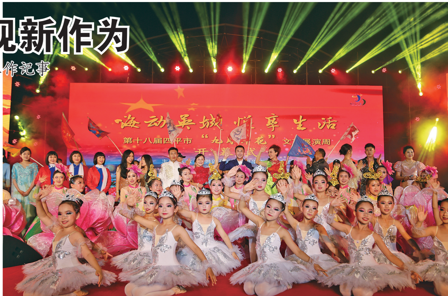
第十八届四平市“九月鲜花”文艺展演周开幕式现场。

2023年是贯彻落实党的二十大精神开局之年。四平市文联积极宣传、贯彻党的二十大精神,深入生活、扎根人民,进乡村、进社区、进企业、进文化馆,开展文艺惠民活动,推动优质