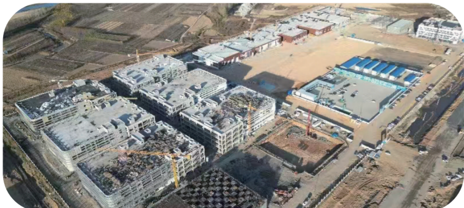
梅河口市引进皓月集团，投资建设梅河口市肉牛产业融合示范园建设项目，打造我省最大的集肉牛养殖、交易、屠宰、饲料、食品加工于一体的三产融合项目基地。（资料图片）

时已初冬，梅河口市肉牛产业融合示范园里机声隆隆，工人们正在抢抓工期，全面加快园区建设，确保尽快投入使用。