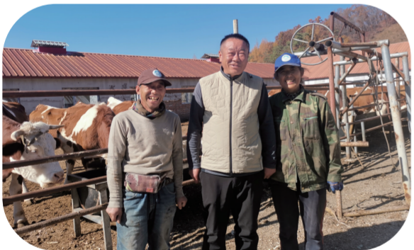
两佳子村村民通过养牛踏上致富路。

在移民后期扶持项目的带动下，旺起镇因地制宜全面发展养牛项目，做好乡村振兴的“牛文章”。该镇已累计争取各类扶持资金2394.5万元，饲养黄牛396头，初步形成了9村繁育、1村育肥、社区销售的新格局，开启了以黄牛养殖为主产业的规模化、集约化经营发展新路径，乡村特色产业正在逐年发展壮大。