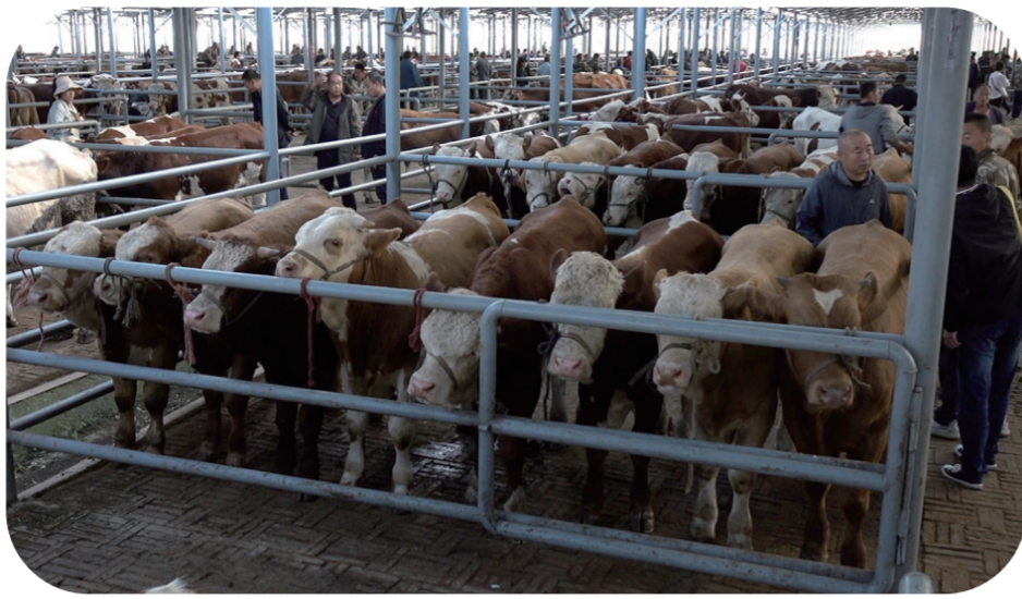
农历每逢三、六、九，桦甸的牛市都是格外的热闹。图为牛经纪人在牛市交易桦甸黄牛。

桦甸市盘桦村家家户户养牛，与桦甸的黄牛创业贷款有着密切的关系——政府全额贴息，每户额度5万元，这大大激发了当地村民养牛的积极性。对于规模比较大的养殖户，桦甸市采取“龙头企业+协会+联合体+合作社+家庭农场+村集体+农户”的多元化合作模式，带动了6500多户养殖户。当地龙头企业还联合科研院所，研究