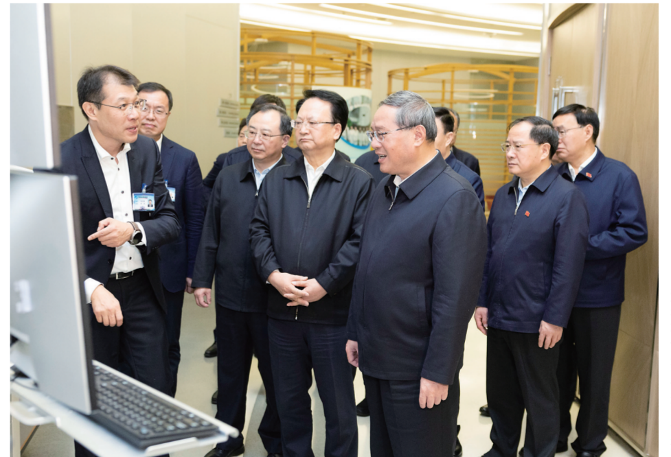
十一月十四日至十六日,中共中央政治局常委、国务院总理李强在黑龙江、吉林调研。这是十一月十五日,李强在中国科学院长春光机所参观实验室及新成果展示。

新华社长春11月16日电 中共中央政治局常委、国务院总理李强11月14日至16日在黑龙江、吉林调研。他强调,要深