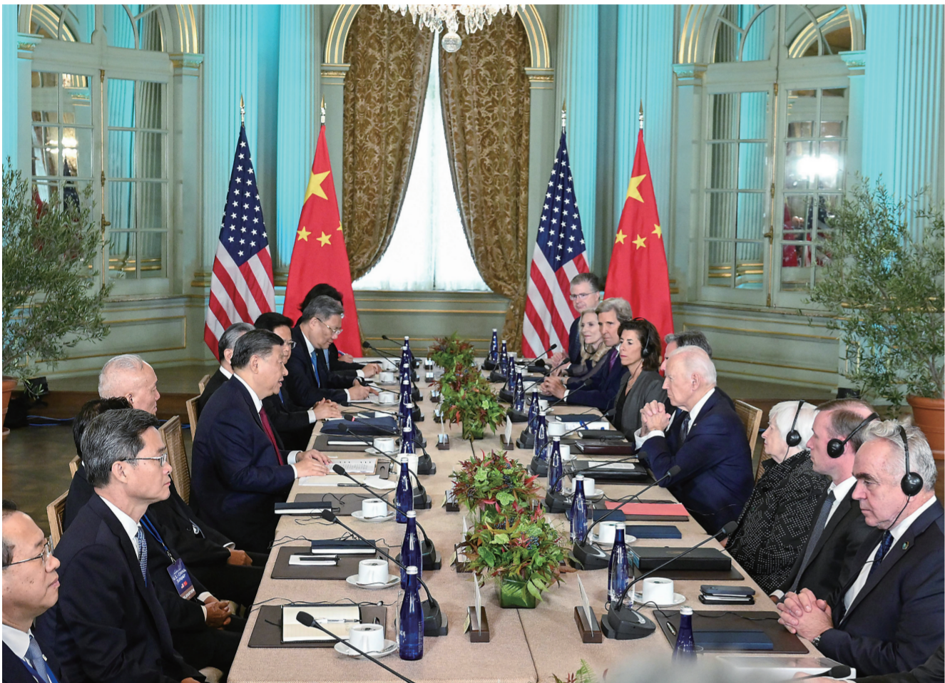
当地时间11月15日,国家主席习近平在美国旧金山斐洛里庄园同美国总统拜登举行中美元首会晤。