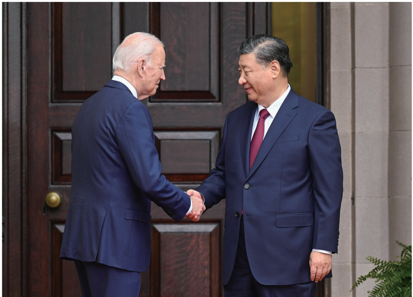
当地时间11月15日,国家主席习近平在美国旧金山斐洛里庄园同美国总统拜登举行中美元首会晤。