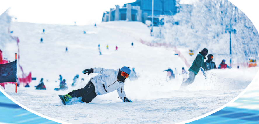
万科松花湖滑雪场成为滑雪发烧友们的乐园。

在北大湖冰雪主题度假小镇里,拥有1座极悦场冰雪运动康复中心,可供滑雪爱好者滑雪过后,一品雪脚下泡脚汤带来的浪漫身心之旅。这里配有颇具人气的露天风吕、按摩风吕,在感受泡汤魅力之余还能尽情享受美食。