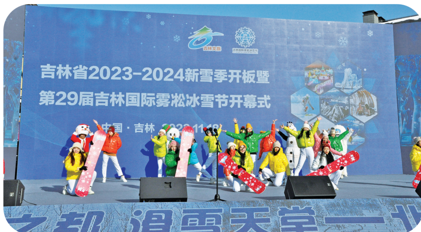
万科松花湖滑雪场开板。

走进吉林市的神农温泉,只见室外汤池里散发着氤氲温暖的水蒸气。游客可披着毛巾走到室外,“扑通”一声跳进热气腾腾的汤池,只把脑袋留在外面,看着蒸汽在额头的发丝凝结成霜,那份惬意也只有东北冬季可以体验到。沐浴在温暖的热水中,同时还可以欣赏池边美丽的雾凇或冰挂美景。“冰雪+温泉”这一“冰火交融”的特色旅游元素,如今已经吸引了越来越多的国内外游客慕名前来,吉林市成为许多游客眼中绝美的温泉旅游目的地。今年,神农温泉新推出了神农私汤,可以独享私人定制级的纯净温泉水。