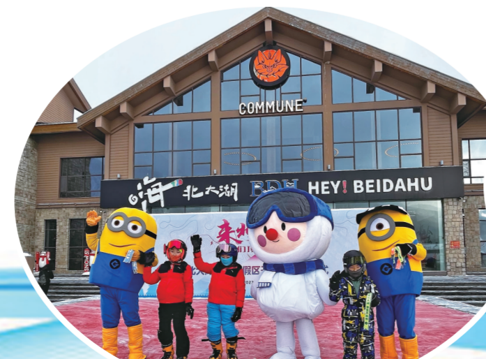
北大湖滑雪度假区11月18日上午正式开板。