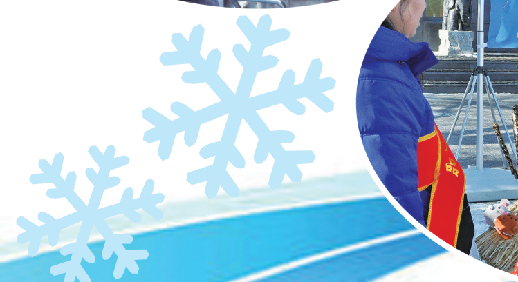
温泉主题日现场的东北特色小吃糖葫芦。