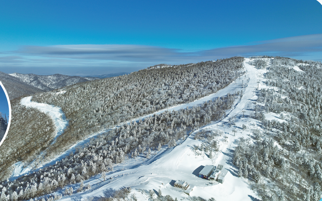
北大湖滑雪场新赛季全面升级。