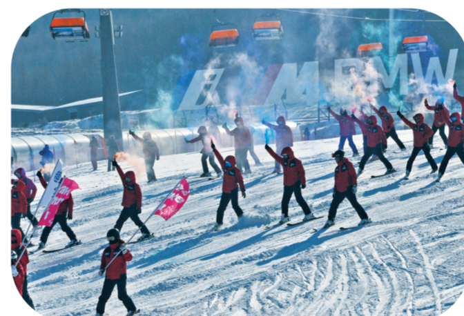
第29届吉林国际雾凇冰雪节开幕式现场表演精彩纷呈。

吉林市坐拥1500平方公里最美冰雪温泉带,他们以国家4A级旅游景区神农庄园为代表,以桦皮厂——瓜店子温泉集聚区为依托,联动全市8家温泉企业,在新雪季推出“大学生温泉”“老年康养温泉”等系列活动和各项门票折扣等优惠政策,为市民、游客朋友们提供多类型、高品质的冰雪温泉度假服务。