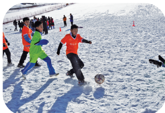
开板现场举行了雪地足球赛。