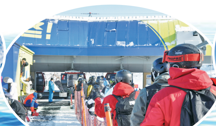
雪友们已经迫不及待,准备今年开滑!