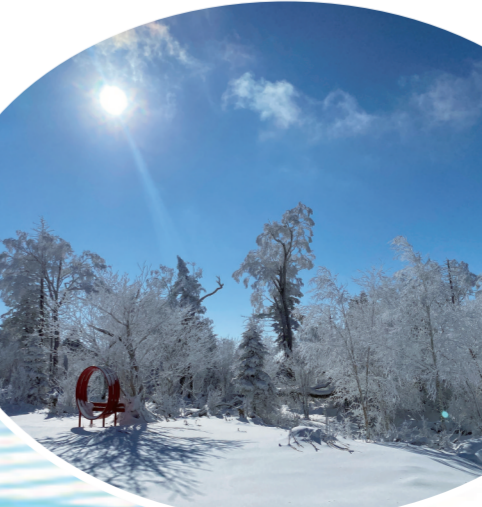
北大湖高山雾凇十分壮观。

同时,吉林市还安排了16个超级周末,以丰富的旅游产品供给、特色夜游夜娱夜购,实现广大游客周五晚上乘兴而来,周日晚上尽兴而归,一个周末尽享江城冰雪百味风情。