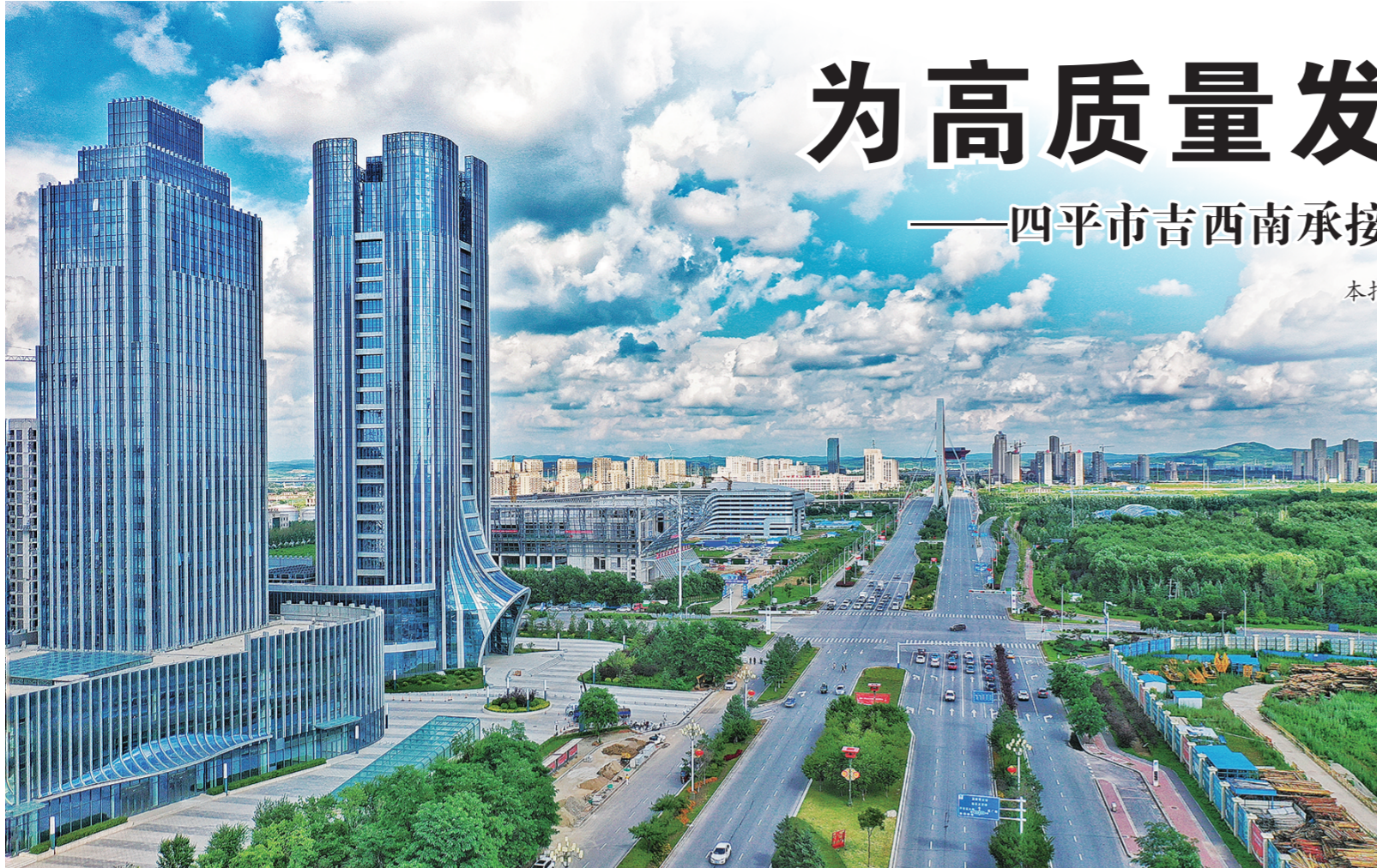
发展中的四平。

时不我待，只争朝夕。吉西南承接产业转移示范区成功获批以来，四平市依托区位优势，紧紧围绕发展定位和主攻方向，抢抓机遇、科学定位、靶向招商，将示范区建设谋在长远、干在实处、走在前列，凝心聚力打造具有四平片区特色的承接产业转移示范区，为经济社会高质量发展增添新动能。