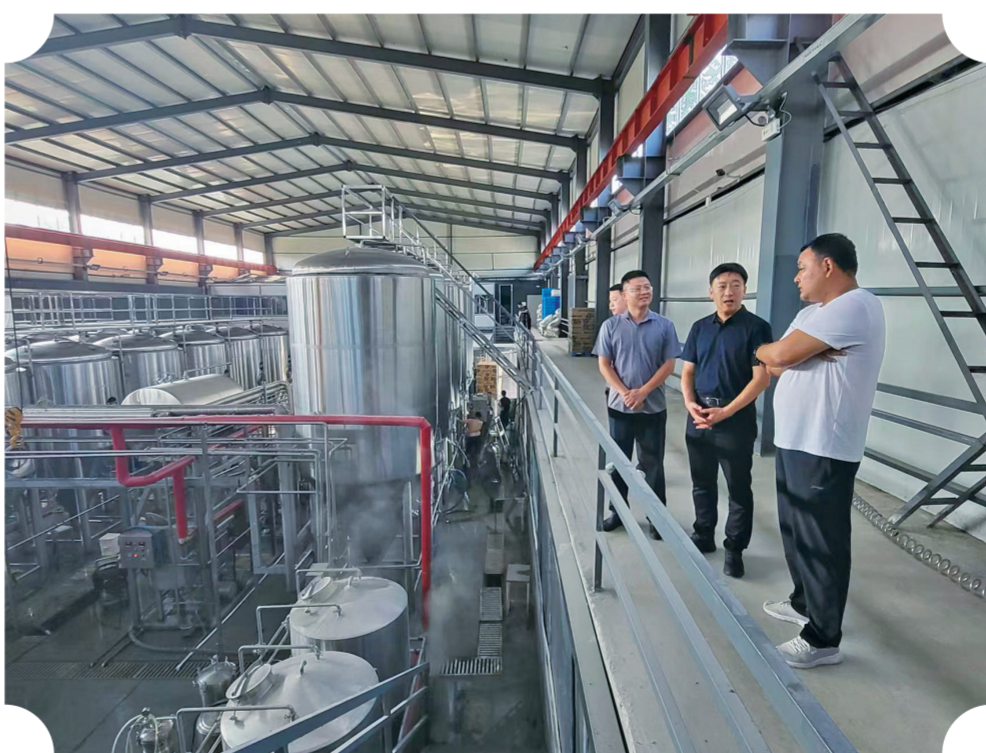
四平经济开发区赴山东迈拓啤酒设备有限公司，开展招商洽谈活动。

提升承接能力。四平市把承接产业转移与产业结构调整、产业升级结合起来，坚持绿色承接、高端承接、集群承接。紧紧围绕全市8大重点产业，有针对性地开展招商引资，不断提升产业契合度，更好地建链、延链、补链、强链，做大做强“本土特色”。装备制造产业，精准承接东北地区重型装备制造产业集群、长三角和珠三角高端装备制造产业集群，遴选一批具有竞争力的先进制造业“链主”“链核”企业，带动“专精特新”中小微企业成链成片发展；农产品和食品加工产业，承接打造一批产业链、供应链、金融链、人才链、价值链“五链同构”的企业；绿色载能产业，承接长三角、京津冀地区的能源综合应用和新能源赛道；