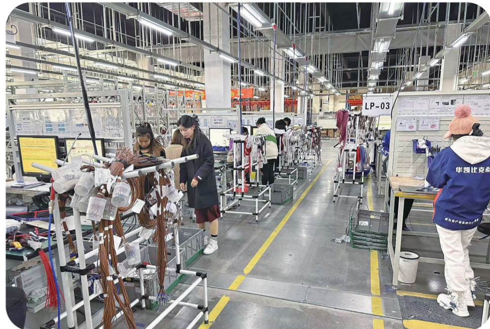
吉林华凯比克商用车线束项目，主要为一汽解放J6、J7重卡生产配套线束产品。

各县(市)区、开发区加快招商引资进度。截至目前，各开发区围绕承接产业转移示范区，开展“走出去、请进来”招商引资洽谈，签约招商项目41个，计划总投资238.72亿元。其中，铁西区15个、梨树县12个、铁东区9个、伊通满族自治县5个。红开区秸秆饲料粉碎机、经开区年产900吨精酿啤酒等项目，已顺利开工；新开区由重庆博观投资10亿元建设的年产500万吨改性