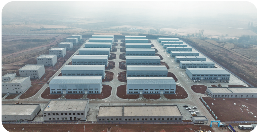
本版图片均为资料图片

21家市直部门共开展“走出去”招商活动28次，考察地点包括北京、上海、广东、陕西、浙江等地。1月至10月，市直各部门签约落地项目32个，合同引资37.19亿元，到位资金14.46亿元。