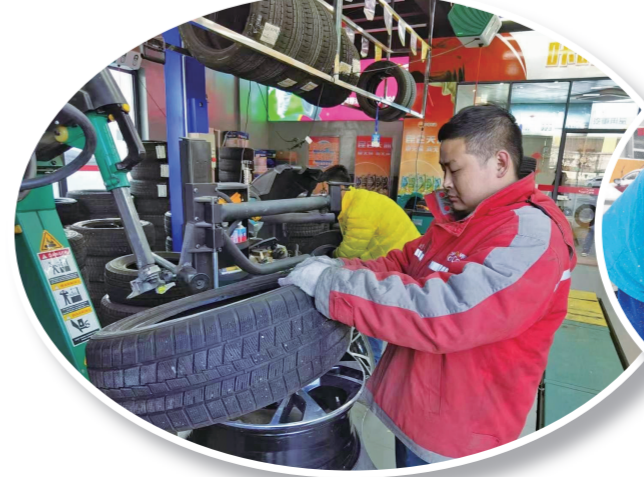
长春分公司卓越汽服店内,工作人员为客户更换雪地胎。