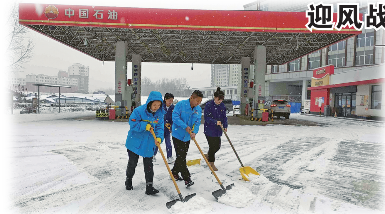
白山分公司口岸加油站员工及时清理积雪。