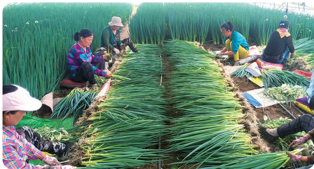
怀德镇三里堡子村把“小香葱”做成“大产业”，走出了强村富民的发展新路子。(资料图片)

乡村文化振兴，关键在干，关键在人。农民是乡村文化振兴的主体，全镇不断引导广大农民学文化、学技能，提高参与度；尊重农民意愿，广泛依靠农民，吸引一批乡土文化人才、培育群众文艺团队扎根乡村“种文化”，让乡村文化人才在希望的田野上大显身手，乡亲们的日子越过越有滋味。