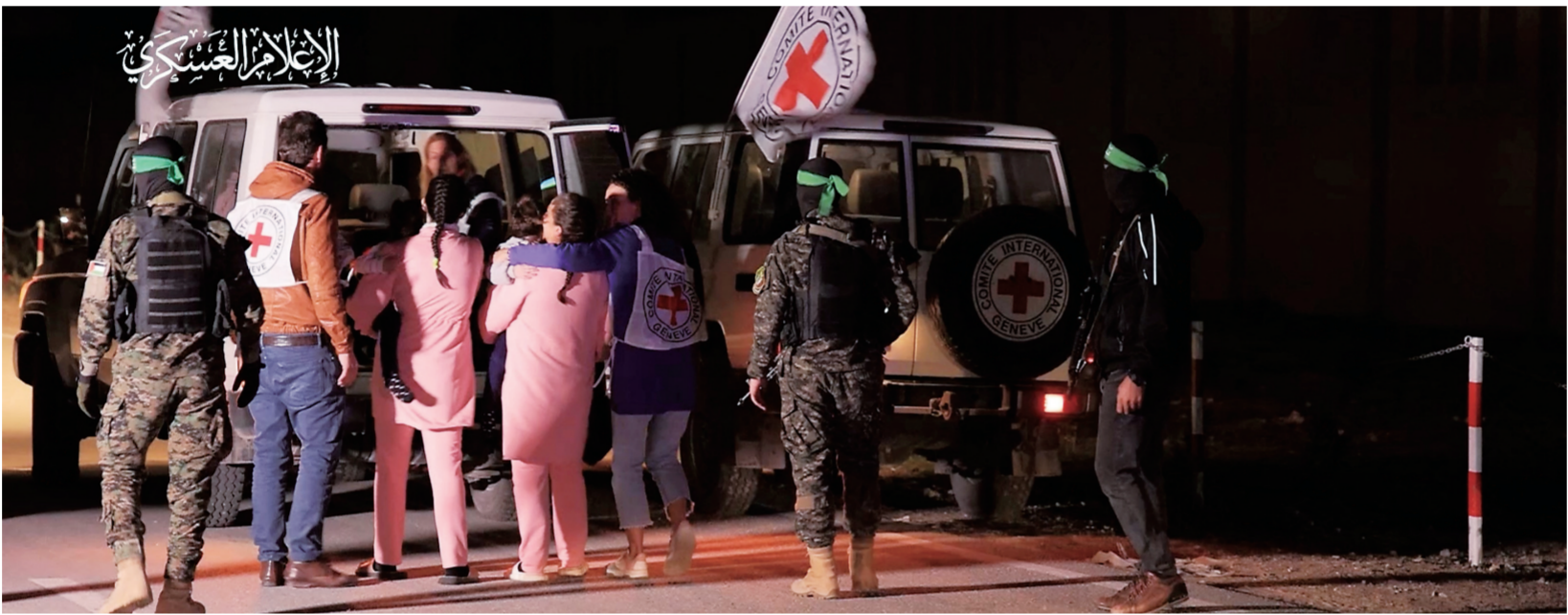
这张11月27日的视频截图显示，在加沙地带，巴勒斯坦伊斯兰抵抗运动(哈马斯)武装人员将获释人员移交红十字国际委员会。巴勒斯坦消息人士27日表示，巴勒斯坦伊斯兰抵抗运动(哈马斯)下属武装派别卡桑旅当晚释放第四批被扣押人员，并将其移交红十字国际委员会。