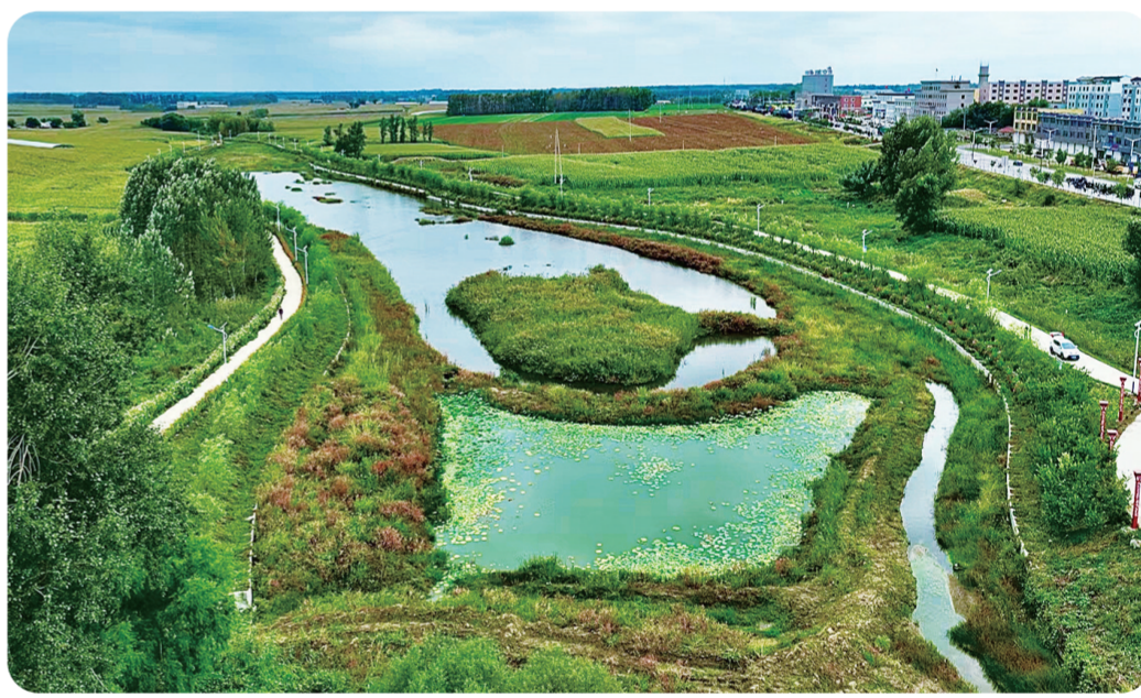
近年来，怀德镇扎实推动河长制，全镇河湖经历了“净”“清”“美”的华丽升级。(资料图片)

三里堡子村的产业发展只是怀德镇大力实施乡村振兴战略，促进全民增收的一个缩影。近年来，怀德镇大力鼓励发展庭院经济和棚膜经济，着重擦亮中国油豆角之乡这块金字