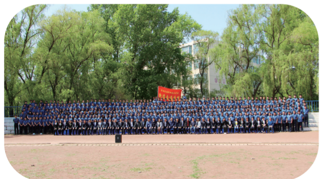
校企融合构建轨道交通协同创新团队。

吉林交通职业技术学院作为全国第一批、吉林省第一所高等职业技术学院，始终将产教融合、校企合作作为学校办学治校能力、提升教育水平、提高人才培养质量的发力点，依托吉林交通运输职教集团平台，与多家紧密型合作企业开展现代学徒制、订单班、现代产业学院、企业工作站等形式的校企合作，在产教融合方面积累了丰富的理论与实践成果，形成了许多可复制、可推广的经验及做法。