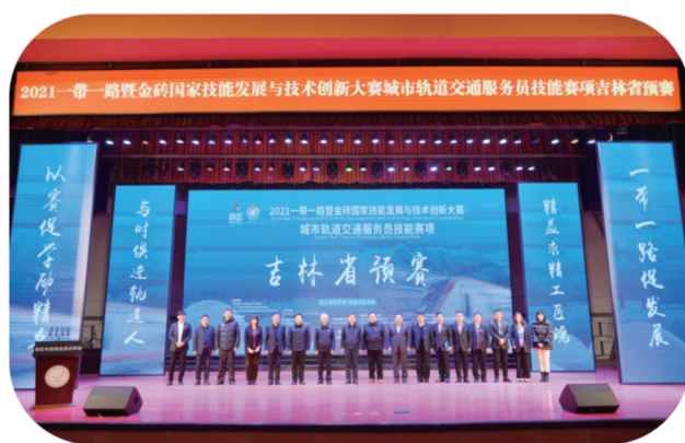
学校承办“一带一路”暨金砖国家技能发展与技术创新大赛城市轨道交通服务技能竞赛吉林赛区。

轨道交通协同创新团队积极打造明星赛区、竞赛实训基地，为学生提供了良好的实训平台。学生在第一学期积极参与第二课堂学习；第二学年协同创新团队为学生提供各种参与、实训、实验等实践，累计约500学时，学生利用实训平台参