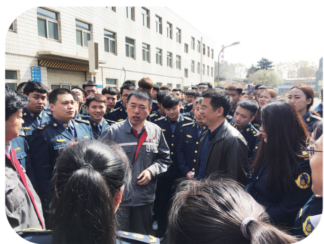
协同创新团队开展活动。