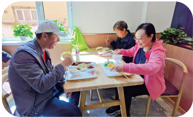
在拥军大院社区敬老餐厅用餐的老人脸上洋溢着幸福的笑容。

如今，随着社会的发展和人口老龄化的加剧，养老问题已成为现代社会最为关注的话题。一直以来，长春市宽城区通过对养老服务体系的创新，逐步解决一些老年人身体健康逐渐衰退、精神孤独和社会参与度降低等问题，并通过一系列创新和实践，为老年人构建了一个温馨、便利的养老环境。