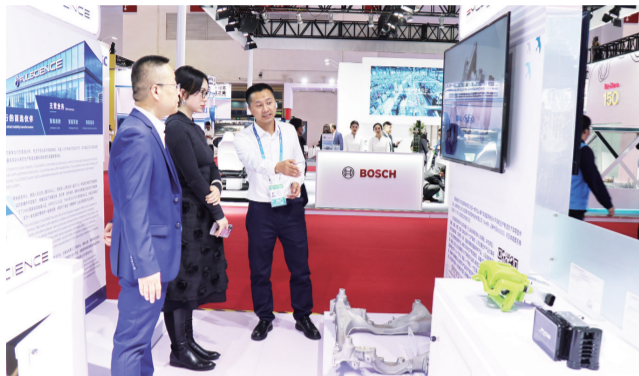
富奥威泰克汽车底盘系统有限公司承接一汽红旗和一汽奔腾及新能源车企多项底盘系统开发业务，“链博会”上，其产品吸引了众多参观者咨询了解。

亮相即精彩，“揭幕”惊艳。 连日来，长春汽开区在首届中国国际供应链促进博览会上始终出众、出彩。携长春市10家重点企业、代表吉林省组团参展，长春汽开区展区的“神秘面纱”一揭开，即刻成为“链博会”的热门“打卡地”，更成为“智能汽车链”展区的“主角”。 以“链”为媒，双向奔赴，合作共赢。在“链博会”这一高水平对外开放的新窗口、构建新发展格局的新平台、建设开放型世界经济的新载体，长春汽开区博得喝彩连连、抢得机遇满满，一张对接全球资源体系、全球创新体系、全球市场体系的“链”网，在此悄然织就。 以参展“链博会”为新起点，长春汽开区将持续拓展国际汽车城的全球汽车生态圈，擘画长春汽车产业高质量发展的新蓝图。