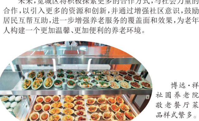
博远·祥社园养老院敬老餐厅菜品样式繁多。

“我们所配备的智慧安全预警设备在报警触发的一瞬间，就会将报警信息发送至我们自己的监控中心和家属的手机上，在没有发生报警时，监控中心也会对一些健康预警设备实时反馈的老人身体情况的数据进行分析研判，并及时对老人和家属进行提醒。”博远·祥社园养老院院长王建东告诉记者，我们会在老人入住养老院前收集好老人的所有健康信息，包括病史、过敏药物、近期是否进行过大型手术、疾病发病率等信息，当老人遇到健康问题需要就医就诊时，后台将会第一时间将这些信息发送给医院，让老人能够第一时间得到高效的医疗救治。 智慧安全预警系统的引入不仅增强了老年人居家生活的安全性，也预示着宽城区养老服务向智能化、高科技化的方向发展。通过这些创新的服务和产品，老年人能够享受到更加安全、便利的生活环境，而他们的家属也能因此获得更多的安心和信任。 未来，宽城区将积极探索更多的合作方式，与社会力量的合作，以引入更多的资源和创新，并通过增强社区意识，鼓励居民互帮互助，进一步增强养老服务的覆盖面和效果，为老年人构建一个更加温馨、更加便利的养老环境。