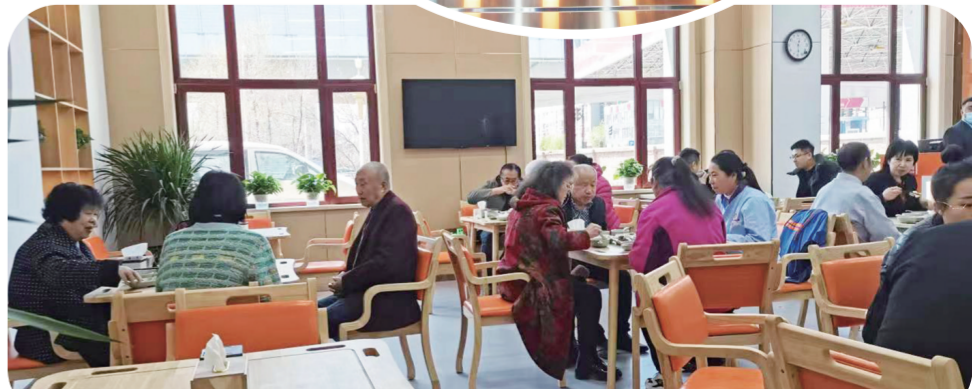
老人们正在博远·祥社园养老院敬老餐厅内用餐。