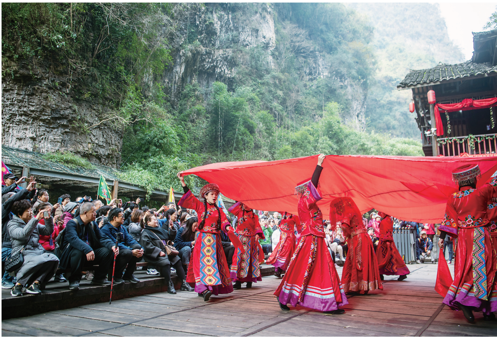
12月2日，在湖北宜昌市夷陵区三峡人家风景区，演艺人员在为游客进行民俗表演。宜昌5A级旅游景区三峡人家依山傍水、风景如画，它以“一肩挑两坝、一江携两溪”的独特地理位置，每年吸引着上百万游人。

（上接第一版）把科技创新摆在国家发展全局的核心位置，全力推动科技自立自强，坚决打赢关键核心技术攻坚战，实现了一个又一个“从0到1”的突破。