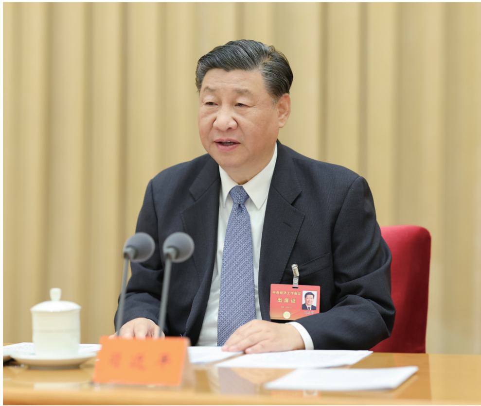
12月11日至12日,中央经济工作会议在北京举行。中共中央总书记、国家主席、中央军委主席习近平出席会议并发表重要讲话。

新华社北京12月12日电 中央经济工作会议12月11日至12日在北京举行。中共中央总书记、国家主席、中央军委主席习近平出席会议并发表重要讲话。中共中央政治局常委李强、赵乐际、王沪宁、蔡奇、丁薛祥、李希出席会议。