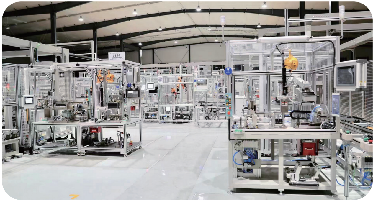
吉林世宝机械制造有限公司电动四向可调转向柱自动装配线。