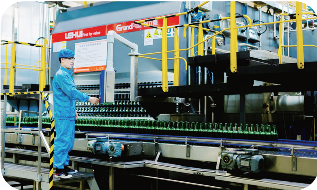
吉林省大窑嘉滨饮品有限公司生产线。

强管理，重融合。推进两化融合管理体系贯标，建立企业自己的两化融合管理体系，对信息化和工业化在技术、产品、服务、管理等多方面进行深度融合，保障企业战略、业务、技术、管