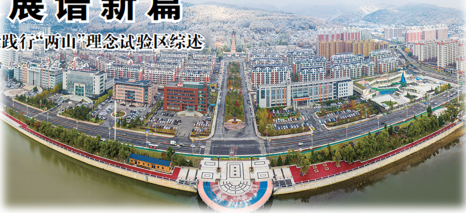
白山市以白派美学和生态理念为核心塑造白派城市风貌,加快绿色城市建设,推动形成绿色低碳的生产生活方式,增强可持续发展的潜力和后劲。图为初雪后的市区。

加快推动高端生态转化为高端产业,白山市全力打造绿色转型发展新高地。全域旅游产业破题成势。升级打造204.7千米松花江水上旅游航线及沿线旅游节点,通航