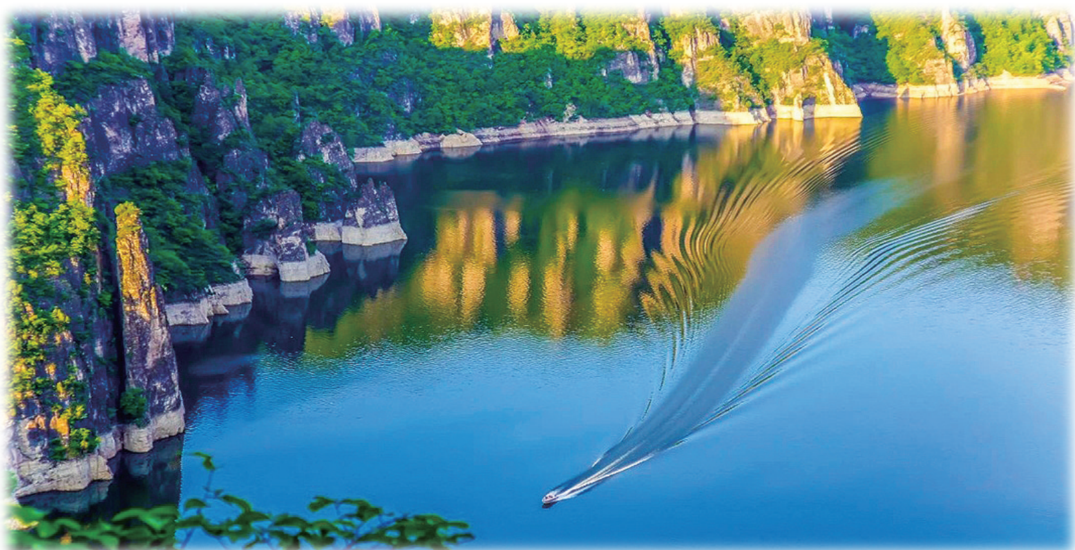
白山市境内的抚松县、靖宇县位于松花江上游,生态环境优良,旅游资源丰富。近年来,白山市整合资源,加大投入,升级打造204.7千米松花江水上旅游航线及沿线旅游节点,通航以来累计接待游客超30万人次,松花江生态旅游风景区获评国家4A级旅游景区。 本版图片为资料图片

新材料、新能源产业释放潜力。深化与中建材战略合作,加快硅藻土资源整合,前三季度,硅藻土产业产值同比增长40.8%。凯盛集团光伏玻璃项目取得重大突破,围绕上下游产业链谋划新材料(新能源)科技创新产业园区,实现延链、补链、强链。抢抓“山水蓄能三峡”建设机遇,积极推动抽水蓄能电站、光伏发电等项目建设,靖宇抽水蓄能项目完成可研报告审查,清洁能源装机占比达56.3%。