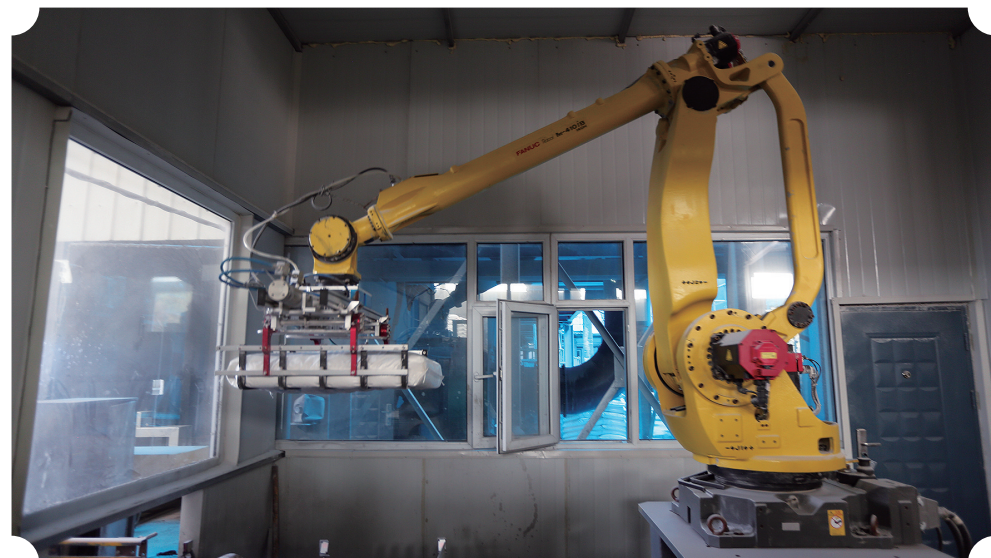
白山市充分利用域内优质的石英砂、硅藻土资源,加快推动光伏玻璃、硅藻土、抽水蓄能等新兴产业集聚发展。图为硅藻土企业生产车间里,自动机械手正在工作。

全市上下深入学习贯彻党的二十大精神,严格落实“第一议题”制度,学习宣讲活动5200余