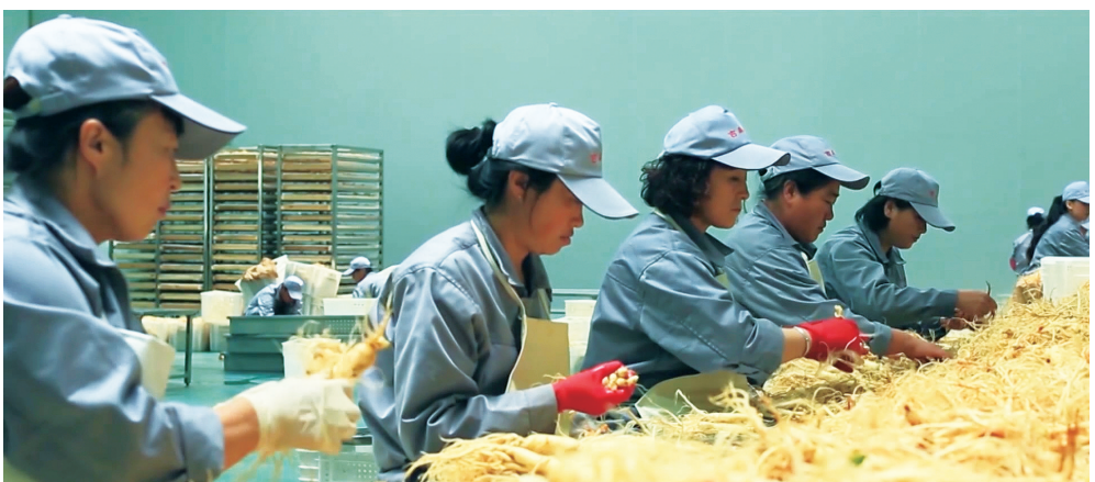
白山市大力实施“长白山人参振兴”工程,全力打造千亿级人参医药产业集群。

实施农村人居环境整治五年提升行动,完成改厕1051户,新建农村公路118千米,农村生活垃圾收运、转运处置体系实现全覆盖。全力推