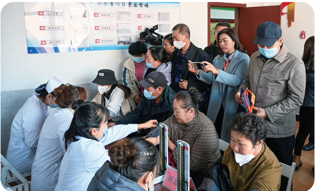
长白山职业技术学院开展以“医者仁心,服务社会”为主题的健康照护科普活动,组织学生深入到白山市的7个社区,发放健康宣传册、进行常规检查、宣讲健康知识,帮助居民发现潜在的患病风险,提升社区居民注重健康饮食、健康体检的意识。

以来累计接待游客超30万人次,松花江生态旅游风景区获评国家4A级旅游景区,沉睡亿万年的松花江上游以崭新姿态呈现在世人面前。临江天沐温泉康养度假区开工建设,长白千年崖城投入运营,成功举办“长白山之夏”文化旅游季和“长白山之冬”冰雪旅游季,全市文旅品牌价值迅速攀升。预计全年接待游客1100万人次,实现旅游综合收入170亿元。吉林省冰雪运动中心项目完成立项、可研、林业设计、路网规划等前期工作,正在积极推进。