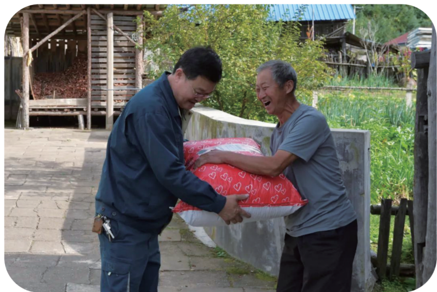
临江市苇沙河镇人口分散,最偏远的人家距邮局60多公里。乡邮员每天穿行在苇沙河镇的各个村落,不仅担负着传递各类快件的重任,更成了山区百姓与外界沟通的桥梁和纽带。

邮政业是重要的社会公用事业,是助力生产发展、推动流通方式转型、促进消费升级的现代化先导性产业。我省聚焦打通农产品进城“最初一公里”和消费品下乡“最后一公里”,积极推动“快递进村”工程,充分发挥“先行官”作用,以实际行动回应人民群众新期待。