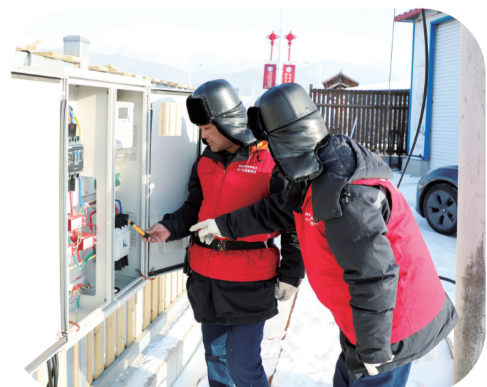
最近,国网永吉县供电公司密切关注天气变化,采取点对点方式,主动服务重点客户,实施“党员责任区+设备主人”服务新模式,开展走访和特巡。图为该公司党员服务队队员为北大湖镇民宿检查用电设备。

入冬以来,松原地区电采暖用电需求增长,为全力保障民生“生命线”及电采暖用户温暖过冬,该公司持续开展“精准服务 电暖寒冬”专项行动,提前梳理辖区内电采暖用电需求,采取“受理即发起”和“先接入后改造”的原则,开辟绿色通道,精简业扩受理流程,组织5支共产党员服务队193名党员对客户报装工单实施分区责任包保,全面提升接电效率。同时,加强电能清洁取暖项目用户所在线路、台区巡视监控,主动对接幼儿园、学校、居民等电采暖用户,实行“一对一负责、一对一维护”服务机制,协助消除安全用电隐患,保障电采暖用户用电无忧。