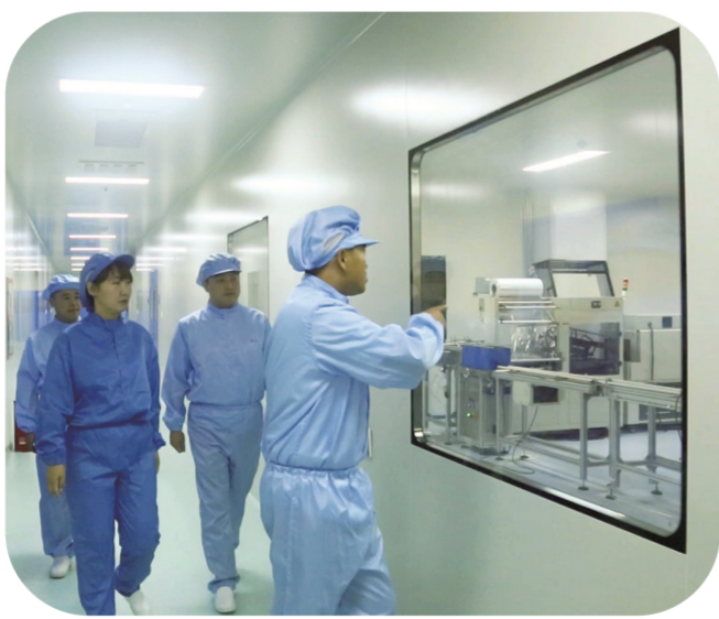
建行工作人员走访企业了解需求。(资料图片)

具体来看,一是设立科创金融服务重点支行——建行长春科技支行。作为服务科技型企业的专属机构,科技支行更加注重科创业务专职人才队伍建设,专业专注,破解科技型企业发展瓶颈问题,为科技型企业提供全生命周期特色服务。二是优化专属评价体系。2021年,建设银行总行建立了“科技企业创新能力评价体系”,将企业科技水平纳入银行授信评价体系,创新科技企业专属评价模型,围绕知识产权这一核心要素,挖掘企业持续创新能力。2023年,建设银行总行创新星光“STAR”专属评价工具,将企业科技水平纳入授信评价体系,真正做到将企业的“软实力”打造成融资的“硬通货”。三是发挥专业评估机构作用。建行拥有自家的资产评估牌照,对企业持有的专利权、商标权、著作权等知识产权进行评估,确认无形资产价值,用于企业融资、并购、转让、出资等不同需要。建行吉林省分行充分发挥专业评估机构作用,落实不看“砖头”看“专利”新金融理念。四是丰富专属产品体系。结合科技型企业特点和需求,打造覆盖企业全生命周期的产品体系,提供信用贷款、知识产权质押贷款等,创新“善新贷”“科技易贷”等专属产品。同时,发挥建行网络供应链金融优势,为科技型企