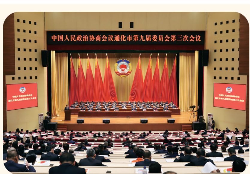
政协通化市第九届委员会第三次会议现场。

届中医药发展与科学大会、第七届长白山医药健康产业论坛、中医药现代化高质量发展峰会、中国通化·奥地利冬季运动高峰论坛、北方区域相关机构