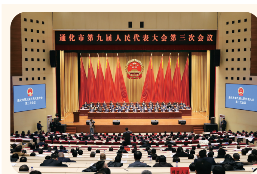
通化市第九届人民代表大会第三次会议现场。本报记者 李铭 摄

一年来，以进取的争先意识、战略思维，成功争得践行绿色发展“新标杆”、现代流通战略支点城市、公交都市等多项国家级荣誉或试点，成功举办第九