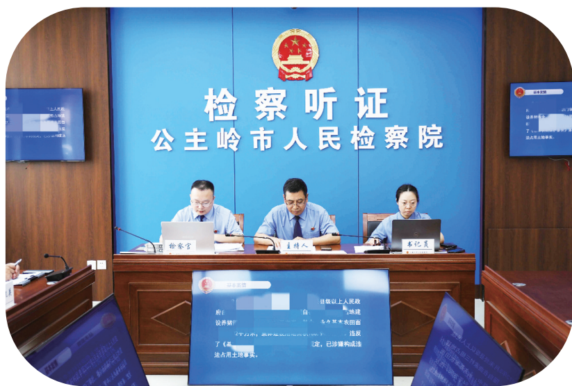
▲2023年7月24日,公主岭市检察机关充分履行公益诉讼检察职能,针对一起非法占用基本农田案件组织召开公开听证会。

吉林省检察机关立足实际,主动破题,制定了《吉林省人民检察院强化检察机关依法一体履职、综合履职、能动履职的实施意见》,提出了包括线索联合研判、双重审查、双向移送,“全面审查”初核,控告申诉案件反向审视等在内的具体举措20条,明确了推进实施意见落实的配套制度清单。这一体系化的思考与谋划,来源于实践探索的总结、理论研究的深化、司法理念的更新。