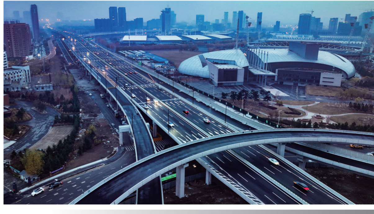
2023年11月1日,长春市世纪大街快速路世纪大街至南四环路路段主线正式开通。城市东南、西南区域经东部快速路、吉林大路快速路与城市东北区域转换的车辆可利用世纪大街快速路通行。此条快速路的开通有效缓解了城市交通压力,使长春市道路更加通畅。图为俯瞰刚刚开通的世纪大街快速路部分路段。