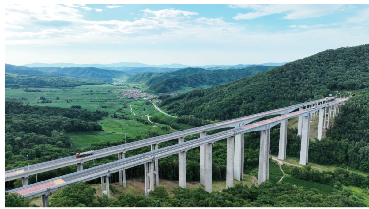
位于柳河县内的祥白高速凉水河特大桥正在进行桥体健康监测项目施工。