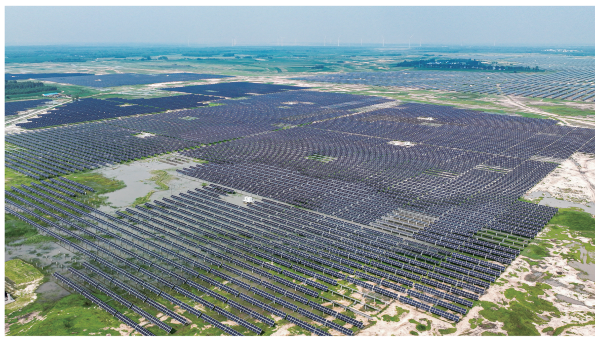
近年来,白城市大力发展新能源产业,全力推进“陆上风光三峡”建设,在通榆、大安、镇赉、洮南等地建设了白城光伏领跑奖励激励基地。图为2023年8月通榆县鸿兴镇绿化村鸿兴项目区光伏设施。