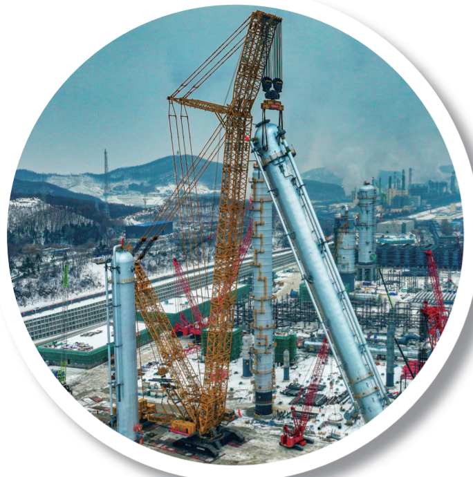
吉林石化炼油化工转型升级项目年产120万吨乙烯建设现场。