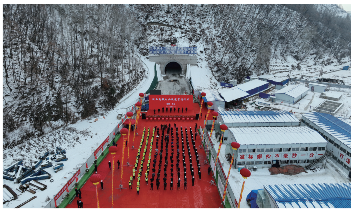
2023年11月21日,历经1100多天的连续奋战,沈白高铁全线最长隧道——白山隧道顺利贯通,隧道全长12.739公里,标志着沈白高铁建设再次取得重大进展。