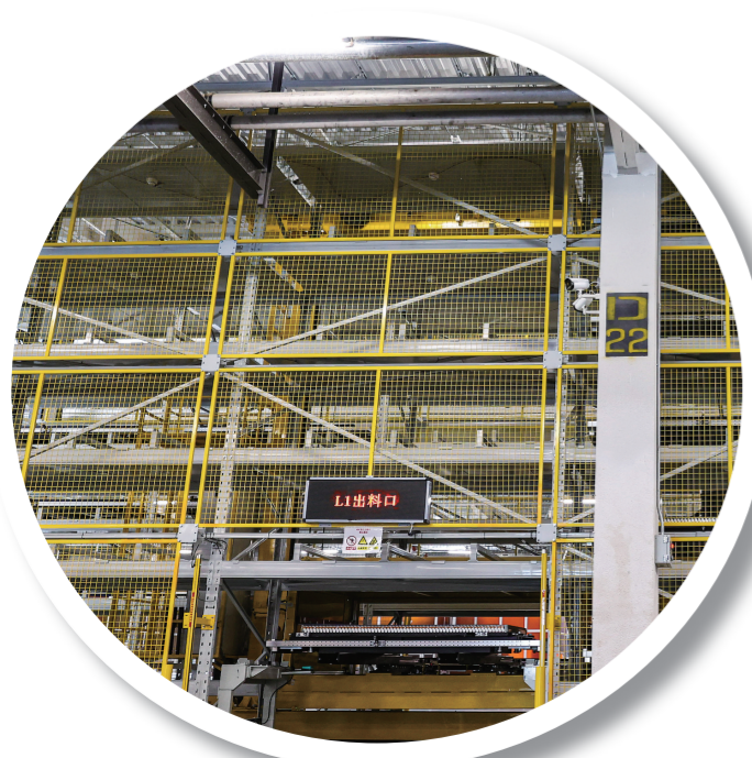
日前,一汽弗迪新能源动力电池项目主体已建设完成,正在进行内部设备的安装调试工作。作为东北地区首家新能源动力电池生产基地,项目一期投产后可为近20万辆新能源汽车配套刀片电池。