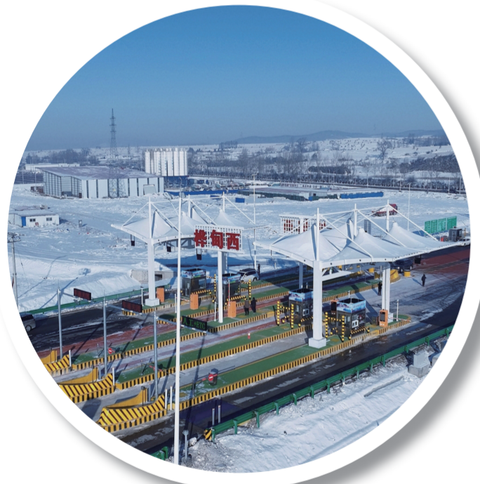
2023年11月30日,大蒲柴河至烟筒山高速公路建成通车。大蒲柴河至烟筒山高速公路作为延(边)长(春)高速公路的一部分,全长191.374公里,是纵贯我省中东部的重要通道。蒲烟高速的建成,结束了桦甸市不通高速公路的历史。