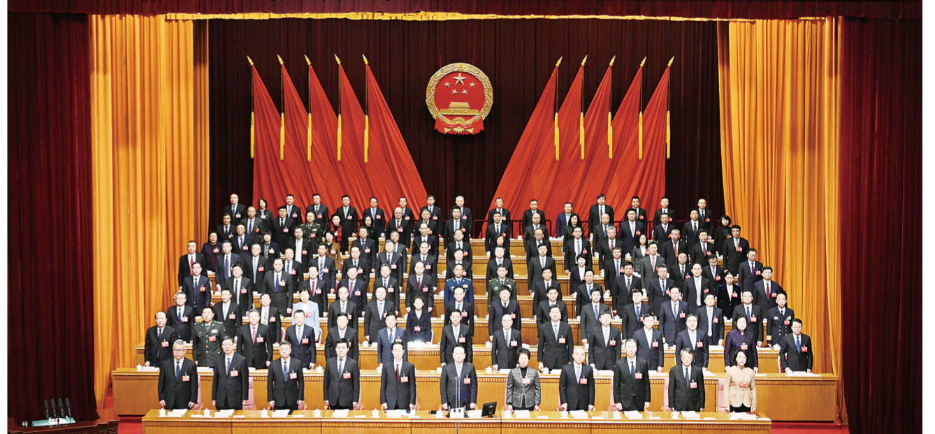
1月24日，省十四届人大三次会议在长春开幕。上图：大会主席台。下图：大会会场。