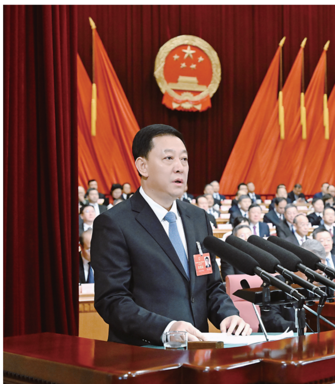
省委副书记、省长胡玉亭作政府工作报告。

本报1月24日讯（记者赵乃政 王子阳 李娜）风起扬帆正当时，凝心聚力开新篇。今天上午，备受全省人民关注的省十四届人大三次会议在长春隆重开幕。