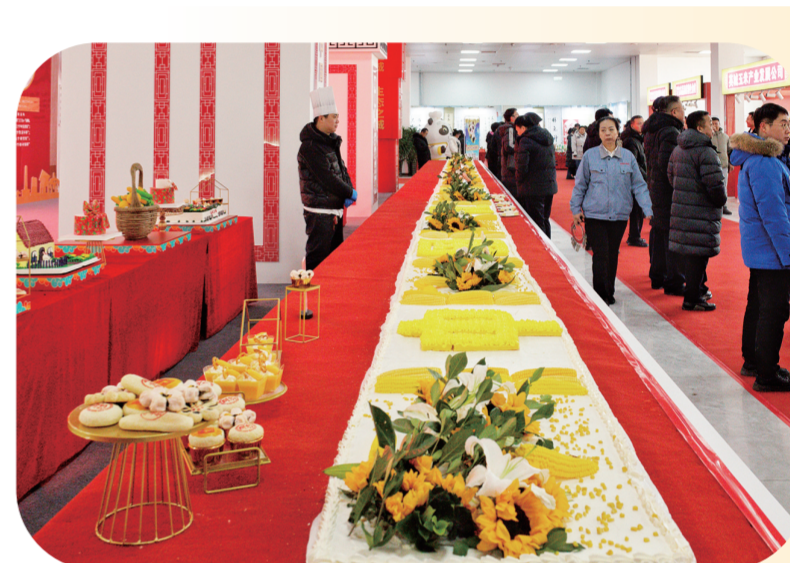
玉米特色产品展区内长达20米的玉米蛋糕。

拓展营销体系新渠道。采取供应链公司规范化运营模式，对四平玉米全品类产品进行规范化、系统化、品牌化营销，提高了四平玉米产品的市场定位和附加值；与新华优品、北京地铁等域外知名企业开展玉米产品销售推广战略合作，拓宽了玉米产品营销渠道，助力四平优质玉米产品热销全国。