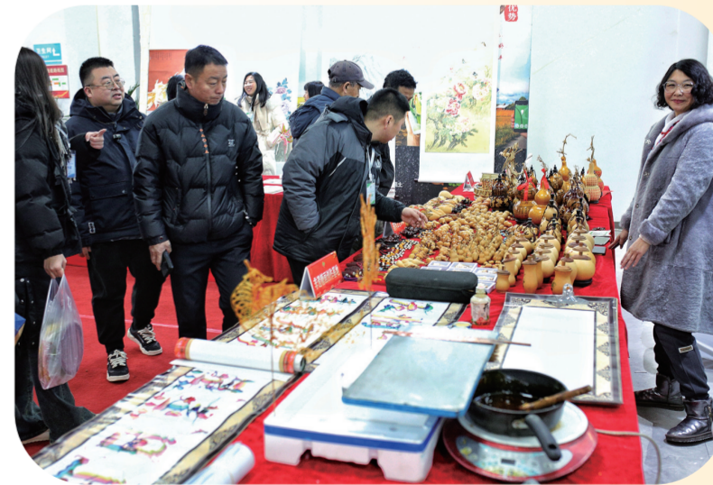
玉米文创产品展区吸引市民驻足。