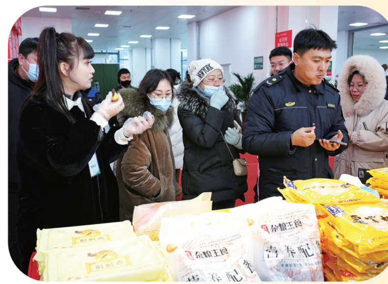
游客争相品尝玉米特色食品。