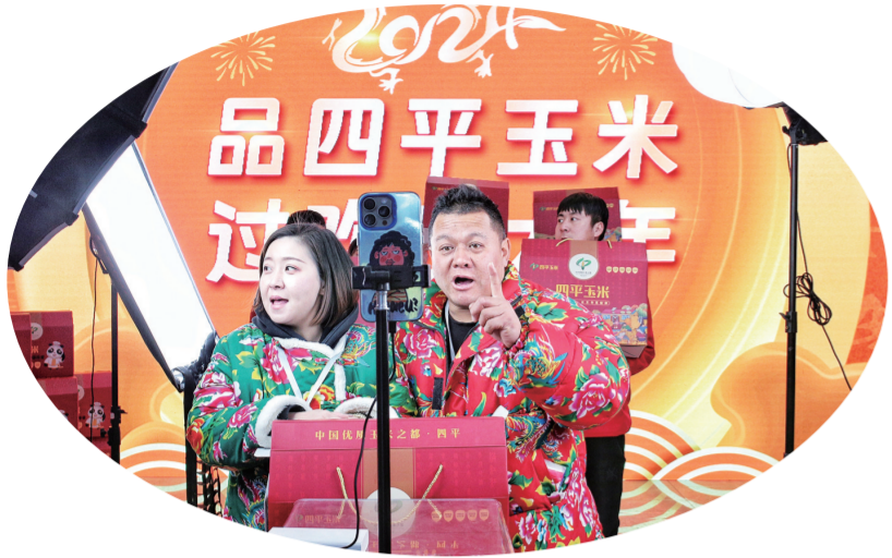
网红在玉米电商线上展区推广四平玉米旗舰店系列产品。