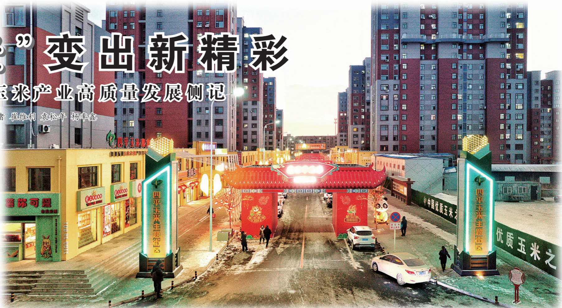
四平玉米主题街区俯瞰。

“造物无言却有情，每于寒尽觉春生。”立春之际，2月1日至3日，四平市委、市政府举办了第二届“品四平玉米，过欢乐大年”优质玉米产品展销品鉴会，百余家企业带着绿色、营养、健康的千余种玉米产品，以及相关衍生品和玉米文创作品，齐聚铁东区金融街大厦。现场熙熙攘攘，人声鼎沸，热闹非凡。据统计，展销品鉴会共接待市民、游客4万余名，现场销售额近400余万元。