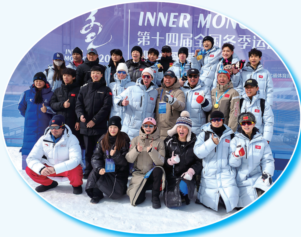
在第十四届全国冬季运动会上,我省运动员包揽了跳台滑雪全部9个小项的金牌。(资料图片)

目前,第十四届全国冬季运动会开幕前期的各项决赛已经结束,第十四届全国冬季运动会开幕式于2月17日在呼伦贝尔市举行。开幕式后,来自全国的冰雪健儿还将在冰上和雪上项目中对99枚金牌发起冲击。