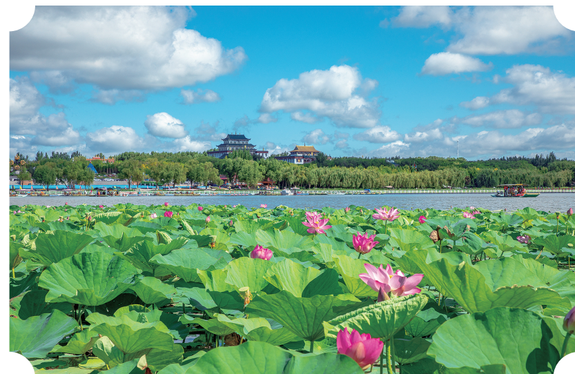
全力做活生态旅游文章。图为夏季查干湖风光。

持续做好查干湖生态保护。加快推进“美丽河湖”建设，完成“一环两线三连通”查干湖水生态修复与治理工程前期工作，力争年内开工。大力实施生态补水和水体交换，推动水生态环境持续改善，确保查干湖水质稳定在IV类标准。抓实生态环保督察问题和巡视巡查、审计反馈问题整改。坚持精准治污、科学治污、依法治污，加