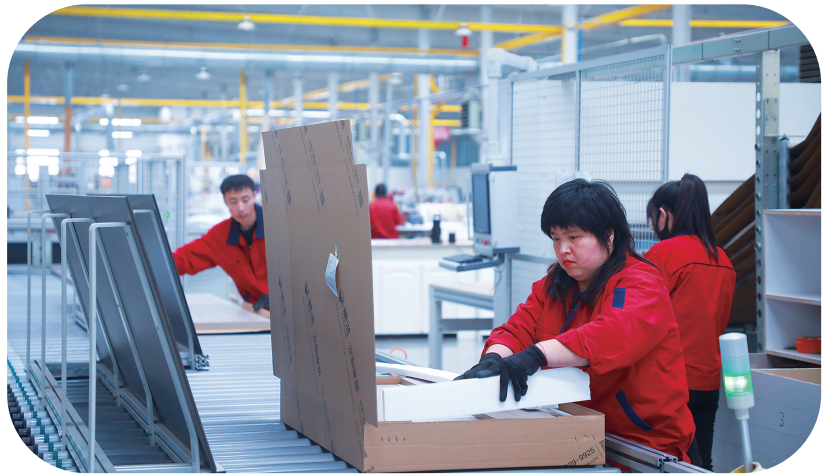
加快推进新型工业化。图为吉林鹏鸿木业有限公司生产车间。

今年，松原将积极顺应转型数字化、服务智能化、社会共享化、产业高级化趋势，积极主动适应和引领新一轮科技革命和产业变革，把高质量发展的要求贯穿新型工