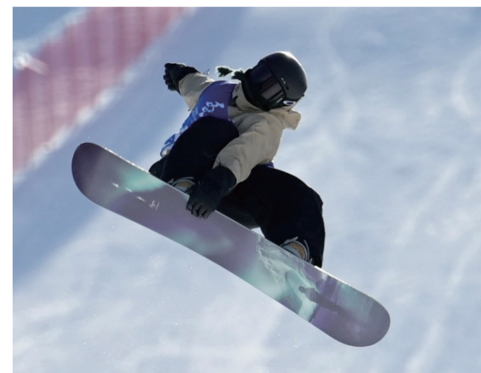
苏翊鸣夺得自由式滑雪单板大跳台男子公开组金牌。

2月23日,在“十四冬”呼伦贝尔扎兰屯赛区进行的单板滑雪公开组男子大跳台的比赛,无疑是众多媒体和观众关注的焦点,因为北京冬奥会冠军苏翊鸣要在这里冲击自己的第一枚全国冬运会金牌。