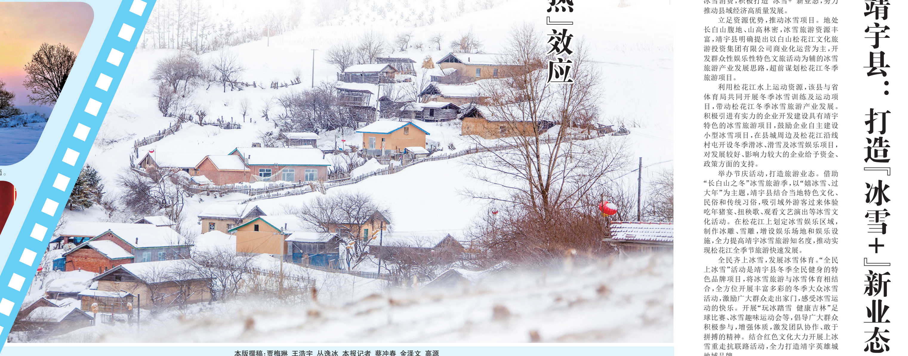
本版撰稿：贾梅琳 王浩宇 丛逸冰 本报记者 蔡春金 金泽文 高源