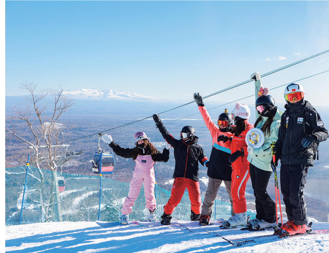
▲在可以远眺长白山主峰的滑雪场上大显身手。