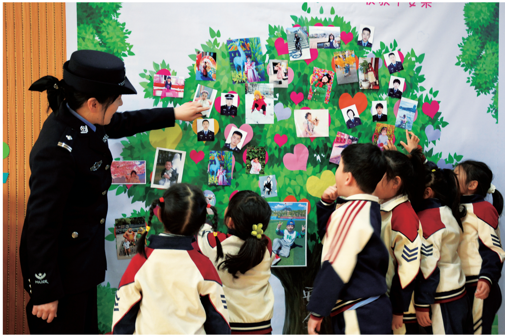
3月12日,吉林白山边境管理支队新市边境派出所民警来到临江市第二幼儿园开展“种下安全树”活动。活动中,民警通过图片、视频、知识问答等多种生动的教学形式,引导幼儿掌握多方面的安全防护知识。