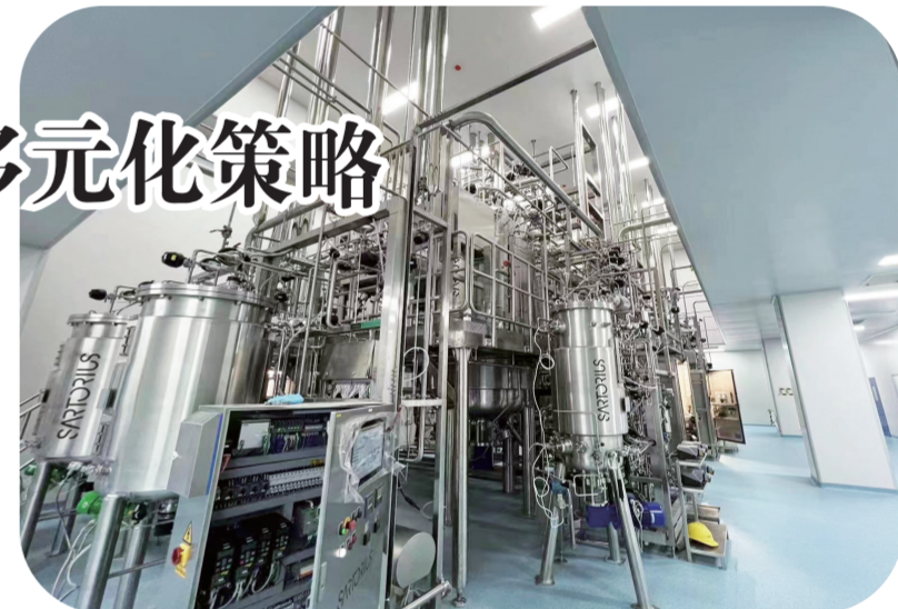
原核中式管线下发酵罐已完成设备安装调试，将在近期投入使用。

首先，让人眼前一亮的是该项目的数字化水平得到大提升。正在建设中的数字化机房，占地面积240平方米左右，采用微模块架构搭建生产、研发、办公三网分离体系，用于支