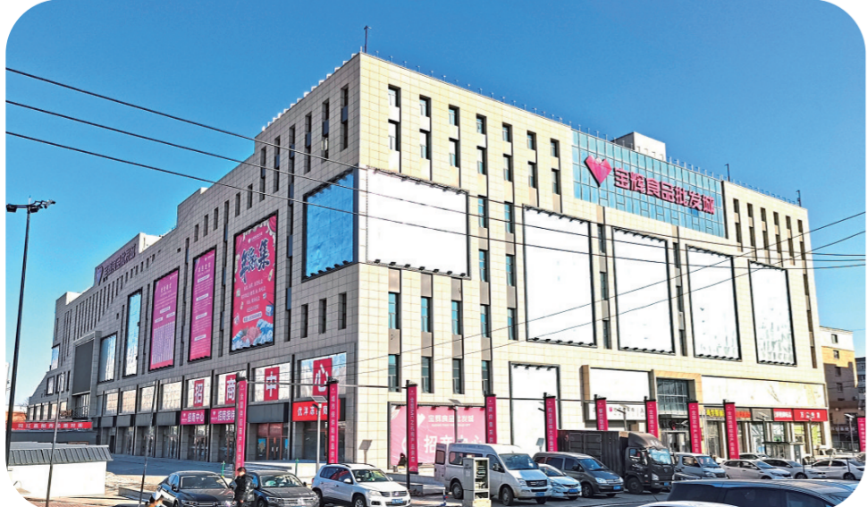
长春市宝辉食品批发城项目即将开业。

“我们现在所在的六层，单层面积10500平方米，中间是4000平方米的‘阳光广场’，