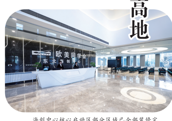
海创中心核心启动区部分区域已全部装修完毕，全面投入使用，并入驻了9户海创企业。

未来，海创中心将按照“一年显雏形、两年固根基、三年见成效”的时序进度，致力于将东北海创中心建成海创人才荟萃、海创企业集聚、海创成果涌流、海创活力迸发、海创环境优越的东北科创高地。