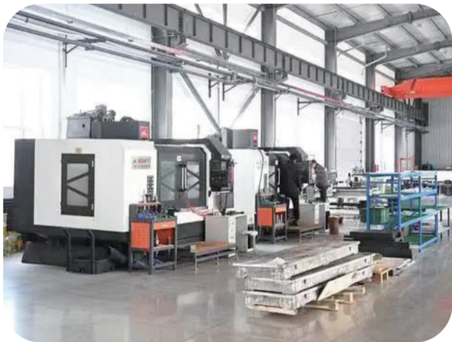
技术人员正在调试生产车间内的自动化机械设备。

此外，和润汽车工业园项目二期预计今年下半年可全部建成并投入使用。届时，整个园区将预计实现年产值20亿元，并提供就业岗位8000余个。