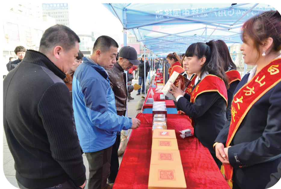
每年的“3·15”国际消费者权益日，白山方大集团员工都要走上街头为消费者宣传鉴别真假酒知识和方法。

用心感动客户，树立诚信品牌。“诚信第一、顾客至上”是白山方大集团的根本宗旨，他们始终遵循着“顾客的满意是白山方大永远的追求”这一服务理念，牢牢守住诚信生命线。