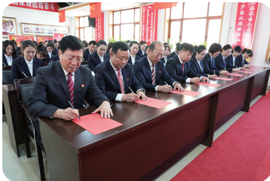
3月9日，白山方大集团员工共同签署《诚信承诺书》。

君子养心，莫善于诚。白山方大集团开展以诚信为主题的职业道德教育，采用“学习+笔记+试卷+演讲比赛”的模式，激励员工主动、认真学习。每名党员都在承诺书中填写“争做诚信使者，履行诚信使命，兑现诚信承诺”的具体做法，彰显了先锋模范作用。