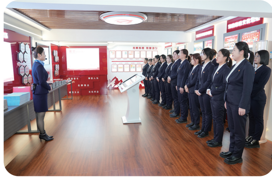
白山方大集团重视诚信文化建设，树立员工诚信经营的理念。

实施商标名牌战略，提升品牌知名度。白山方大集团把商标作为承载企业核心价值观的外在表征，从战略高度经营品牌，维护和巩固品牌的核心价值，不断提升“白山方大”品牌的知名度、美誉度和顾客忠诚度。为建设和培育商标名牌战略发展的良好环境，白山方大集团坚持以人为本、全员参与的商标管理思想，全力推行质量管理体系和商标管理运营模式，形成了以提升理