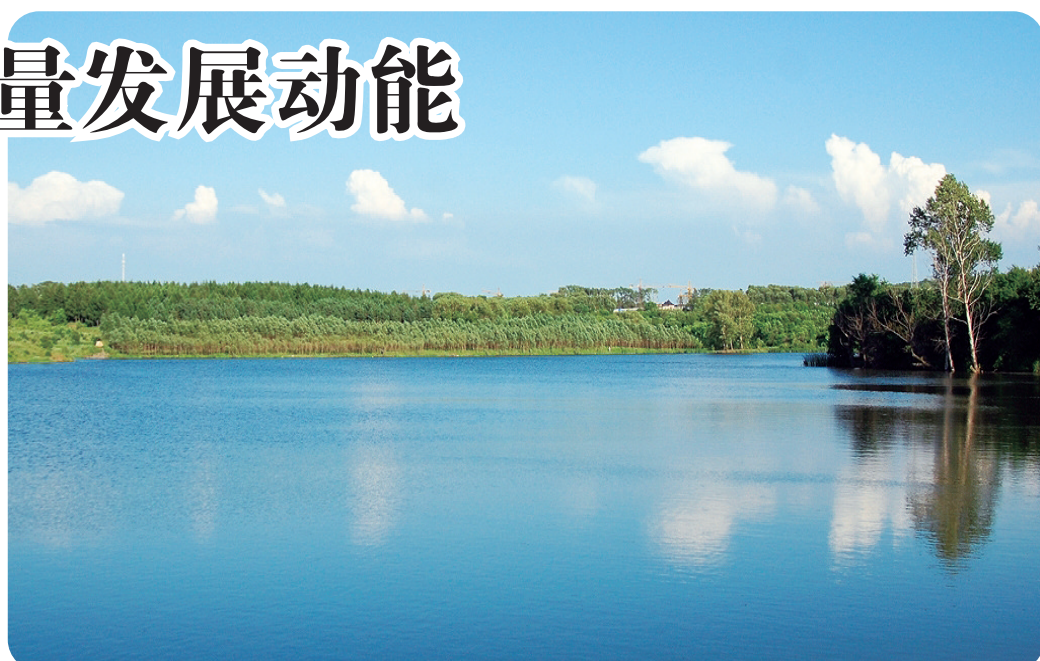
吉林农业大学校园水系非常规水资源利用。(资料图片)

成绩的取得,离不开企业浓厚的节水氛围。九台电厂早在2018年就委托西安热工研究院开展水平衡试验及全厂节水与废水综合治理改造工作的可行性研究工作,对机组取、用、耗水进行测试,查清电厂用水状况,挖掘节水潜力,制定切实可行的节水措施。成立了由厂长任组长的节水领导小组,根据厂情研究制定节水规划,把节水工作纳入企业生产发展规划中。同时,层层分解发电水耗率指标,按月下达给各部门,把完成情况纳入月度经济责任制绩效考核,并与职工收