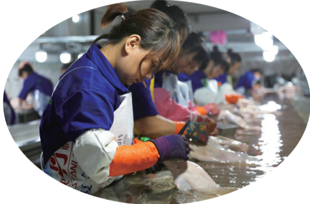
在吉林美中鹅业，工人们正在屠宰加工。