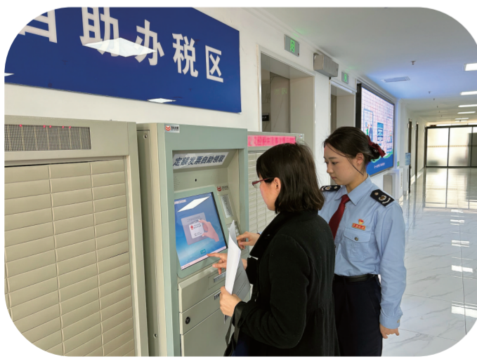
永吉县税务工作人员帮助企业办事人在自助专区办理业务。

年初以来，永吉县委、县政府围绕企业发展全生命周期持续发力，打造便企利企营商环境，通过金融帮扶等手段促进企业良性发展。截至目前，永吉县共发放创业担保贷款2733万元，扶持创业者65人，直接带动就业301人，实现一季度创业担保贷款发放“开门红”。