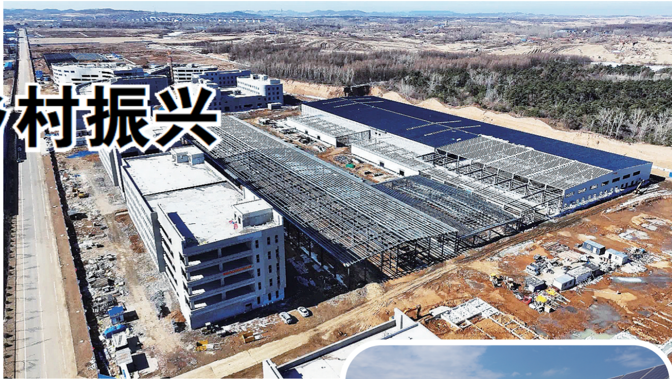
▲舒兰市白鹅产业园加快建设。

在加工上，引进美中鹅业，建设了过渡性屠宰场，目前，日屠宰量达到1.5万只以上。2022年，舒兰市抢抓专项债政策机遇，建设白鹅产业园，打造核心区、屠宰加工区、鹅肉产品生产加工区、鹅饲料生产加工区等八大功能区，总投资14.2亿元，占地面积34.05万平方米。目前，产业园核心区主体工程已经完工，室内装修、水电供热系统完善、设备安装等工作正在有条不紊地进行中；1号屠宰生产线施工进度加快推进，预计今年6月末完成该生产线的主体工程。产业园建成后，将打造集白鹅繁育养殖、屠宰加工、鹅绒生产、羽绒制品加