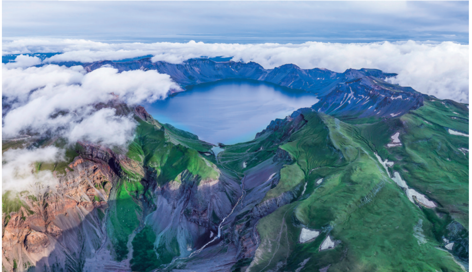
▲雄浑秀美的长白山天池